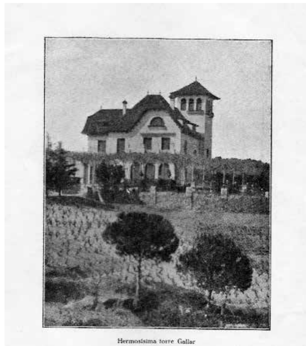
Hermostísima torre Gallar