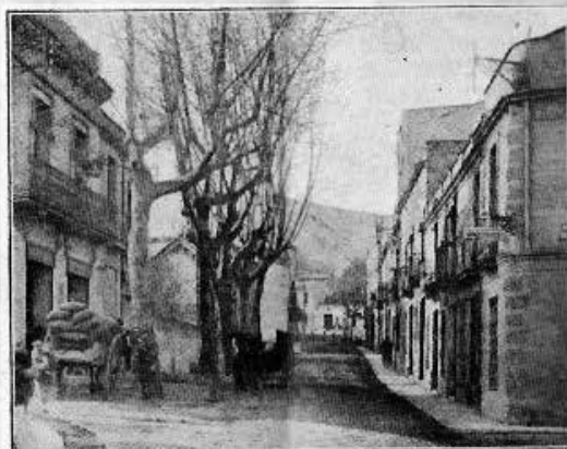
Entrada de Argenton

El Cros es el más poblado de los antedichos caseríos, siguiéndole San Jaume, Lledó, Els Pins, Clará y Puig.