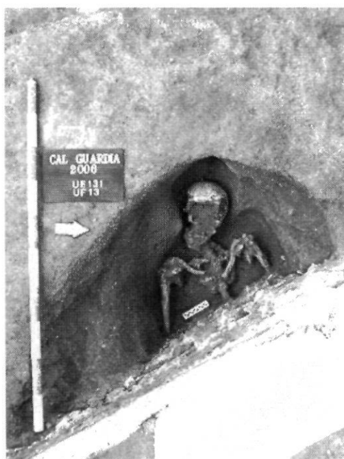
Inhumació en fossa antropomorfa afectada pels murs de la placeta de la font de Sant Domingo