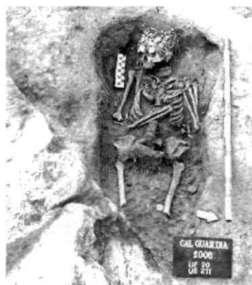
Inhumació en fossa rectangular afectada per fonamentacions posteriors

Tot fa pensar que la necròpolis havia de tenir unes dimensions superiors que no s'han conservat. El terreny ha sofert rebaixos, ja fossin quan eren zones de cultius o a l'hora de construir les cases. El cementiri segurament s'estenia en totes direccions, però per la única part on encara es podria conservar alguna sepultura és per la zona est, on el mur exterior del mas, que separa la plataforma mitja de la superior, pot amagar un pendent suau i la possibilitat que existeixin més inhumacions, tot i que en la rasa i el sondeig realitzats a la plataforma superior els resultats han