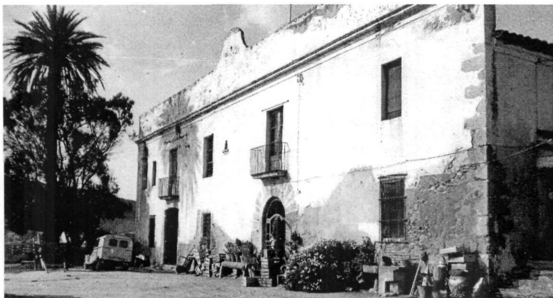
Les Palmeres..

estat de ruïna. El nom de les Palmeres ve donat per què antigament davant de la casa hi havia cinc palmeres, plantades per Carreras Candi, però les glaçades del 1956 en van matar quatre, i ara tan sols en resta una.