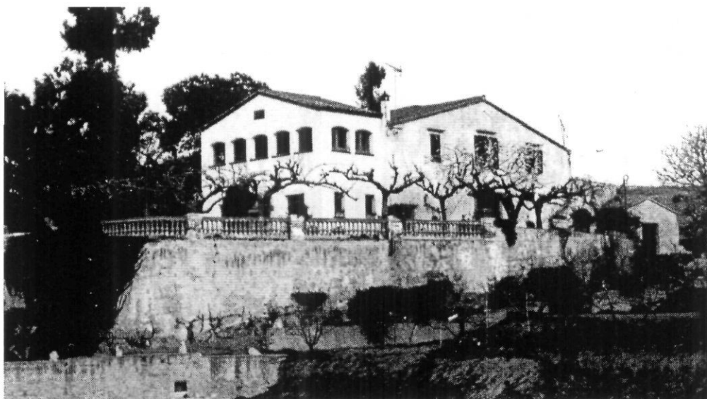
Can Barrau de Traià.