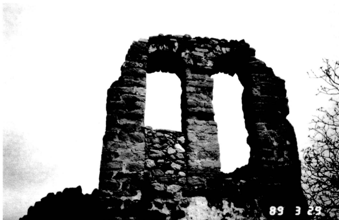
Estat de l'espadanya de ponent l'any 1989, quan va començar la segona fase de restauració de Pedret.