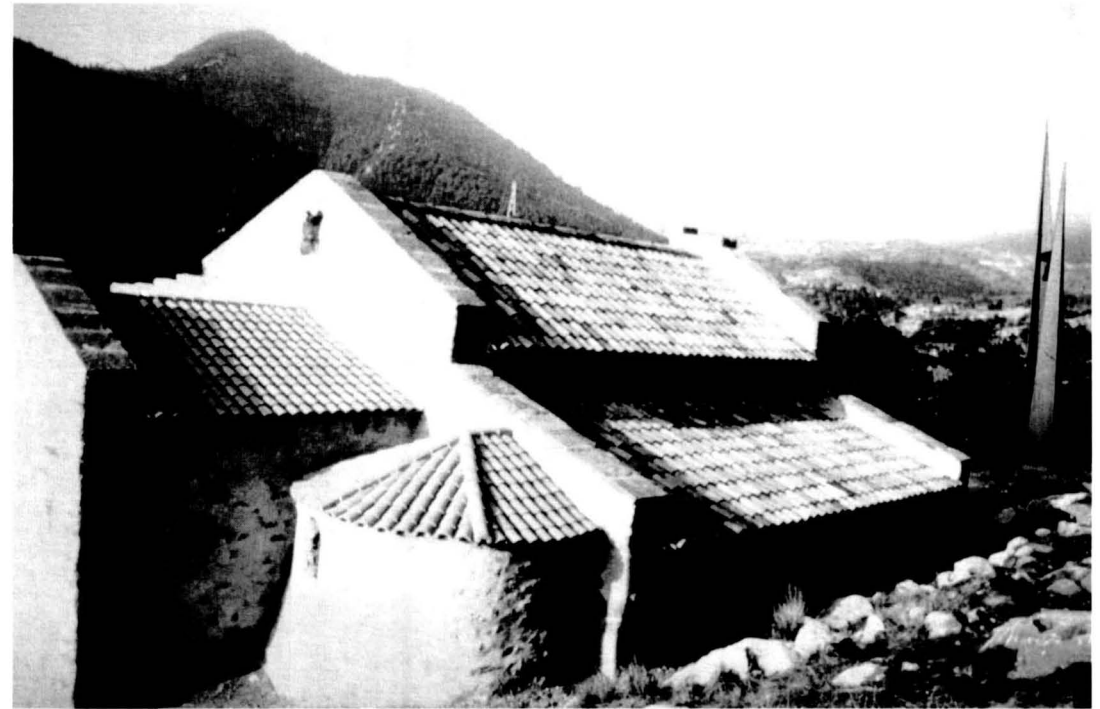
Maqueta del primer projecte de nou campanar. Foto-muntatge.

Per tot això, l'any 1990 (i amb el corresponent permís, fet que sovint s'oblida o s'amaga), vam desmuntar l'espadanya. Alguns carreus, els que no sobresortien del gàlib ideal de la façana del segle X, hi van romandre, tot i que amagats pels morters amb què vam enlleur el parament. Les altres pedres es van aprofitar en part per a construir el porxo de migdia, un espai amb vocació d'heretar de l'espadanya alguns dels elements