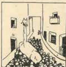
4—El diumenge a la nit, és costum de fer revetlla i cantar-se bon tard al lit.