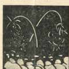
23—No els hi anemiu pas amb jocs, que no cup finta la «Patum», la gent se'n va a veure els Focs.