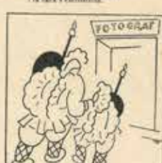
10—Com tallem m'hi ve a dir, passen Sant Miquel i l'Angel cap a fer-se retratar.