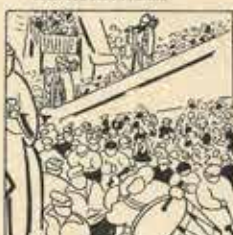
9—En sortir l'Ajuntament, intorges, colics, no pas delict, amb un cant remanent.