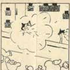
18—A un pagés, que de no gat-vell, per voler equivocar la «Gaita» li peta al mig del stallet.