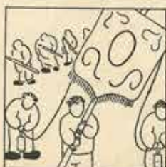
14—Per donar les apendencials, un matí de festa dirigides i un moxador de ballata.