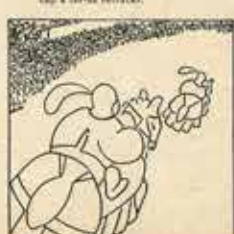
15—Un «Cavall» anexas i el «Turc» ha d'expilar i tallen els crida: «Pagu!!»