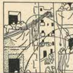
12—Unes donzelles divines, de baló a baló sortiran un brotat de serpentina.