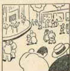
24—Quina gentada d'allí! —Hi ha molt forasteros. —Han vingut perquè es la fira.