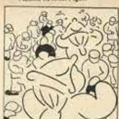
20—Els «Nans», en llurs cabrioles, no s'abreix pas ballar sense tocar les castanyoles.