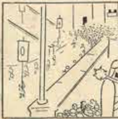
11—Mestre ballen els Gergans, ja van sortir les banderes, ara gergans i anexas.