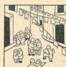
27—La mainada pela carrers, també fan llurs balladetes, Ningú es val privar de veu.