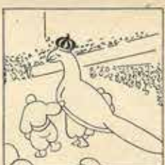
19—Per què faci molt més é, l'Agulla acaba la dansa clouat-se en un ramell.