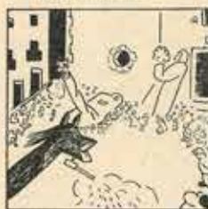
7—Estar que estan molt trodits, tatem els malins demans al «Tirabru» amb grans crits.