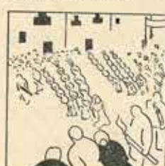
29—Per seguir la tradició, el dijous de repratada, hi torna haver processó.