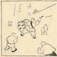
1—El dia de l'Anxanell, surt al «Tàbel» amb gran pompa, recorrent la població.