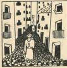
6—Com si feu de presonera, passen al carrer Major, les i costats «Ella s'ha posat».