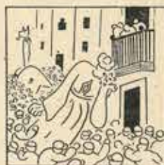
5—Per voler jugó i fer broms, al gignat se'ls fa tonell i la cara s'extremava.