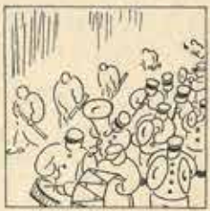
25—Amb la classe ben plantada, i l'aire cap per a vall i el vent ja la «Danada».