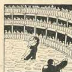
28—Vivencina de colera, esplet de cates boisons, al ball tan sece esplendora.