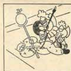
17—L'última «Mansa» fa el petó, el diable cau a terra troçjat pel l'Angel.