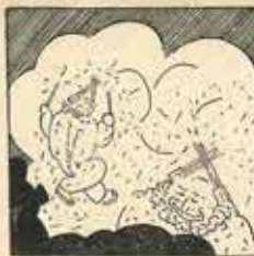
16—Els «Pisus» ja apaguen la llum, ara forma l'espectacle més viu de la Patum.