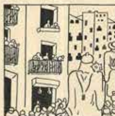
3—Tant el dia així com els grans, tatem d'alta l'assonada per veure passé els Gergats.