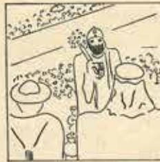
21—Han en ha de perdre de vista, que per fer ballar els «Gigants», al patent de necessitats.