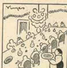
30—Com que el Ball de matí s'ent, i vol mostrar-se agrall, fan fer a l'Ajuntament.

D'aproximada mida se n'ha fet un tiratge especial de cinquanta exemplars en paper 80, numerats del 1 al 50, col·lecció a més i alçats.