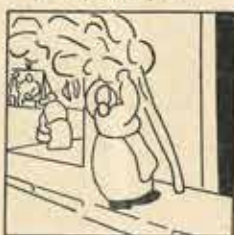
8—La dansa ben entropada, el dijous de bon matí, ja ha colicat l'entremali.