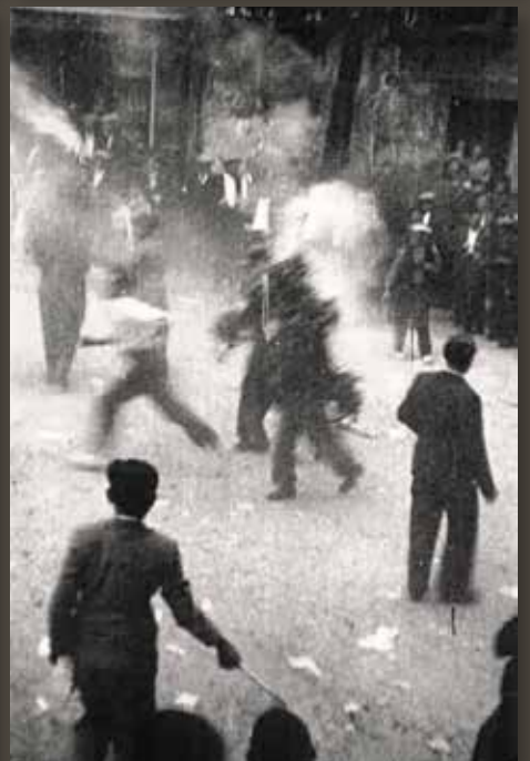
1936, FOTOS JOSEP VINYES, ARXIU JOSEP CARRERES