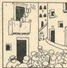
26—Sentiren un fetó siverri, l'equitació ha marcat un val, hi ha una pata jove del barri?