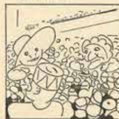
22—Aquesta «Nansa» les l'impresó que són quatre criatures jugant en un carreró.