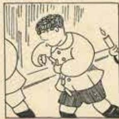
13—Un jabat de adells rosos, de matí el crit corrent i tot amb quatre o cinc trocs.