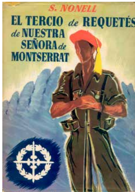
Portada del llibre de Salvador Nonell Así eran nuestros muertos del laureado Tercio de Requetés de Ntra. Sra. de Montserrat

La batalla de l'Ebre va començar la matinada del dia de Sant Jaume quan l'exèrcit republicà va creuar el riu per diferents punts, entre Mequinensa i Amposta. Les operacions inicials foren exitoses per als republicans i aleshores el comandament franquista donà l'ordre de màxima resistència i l'enviament de reforços. Fou aleshores quan el Terç fou enviat al front; hi va arribar el 28 de juliol i van fer el relleu