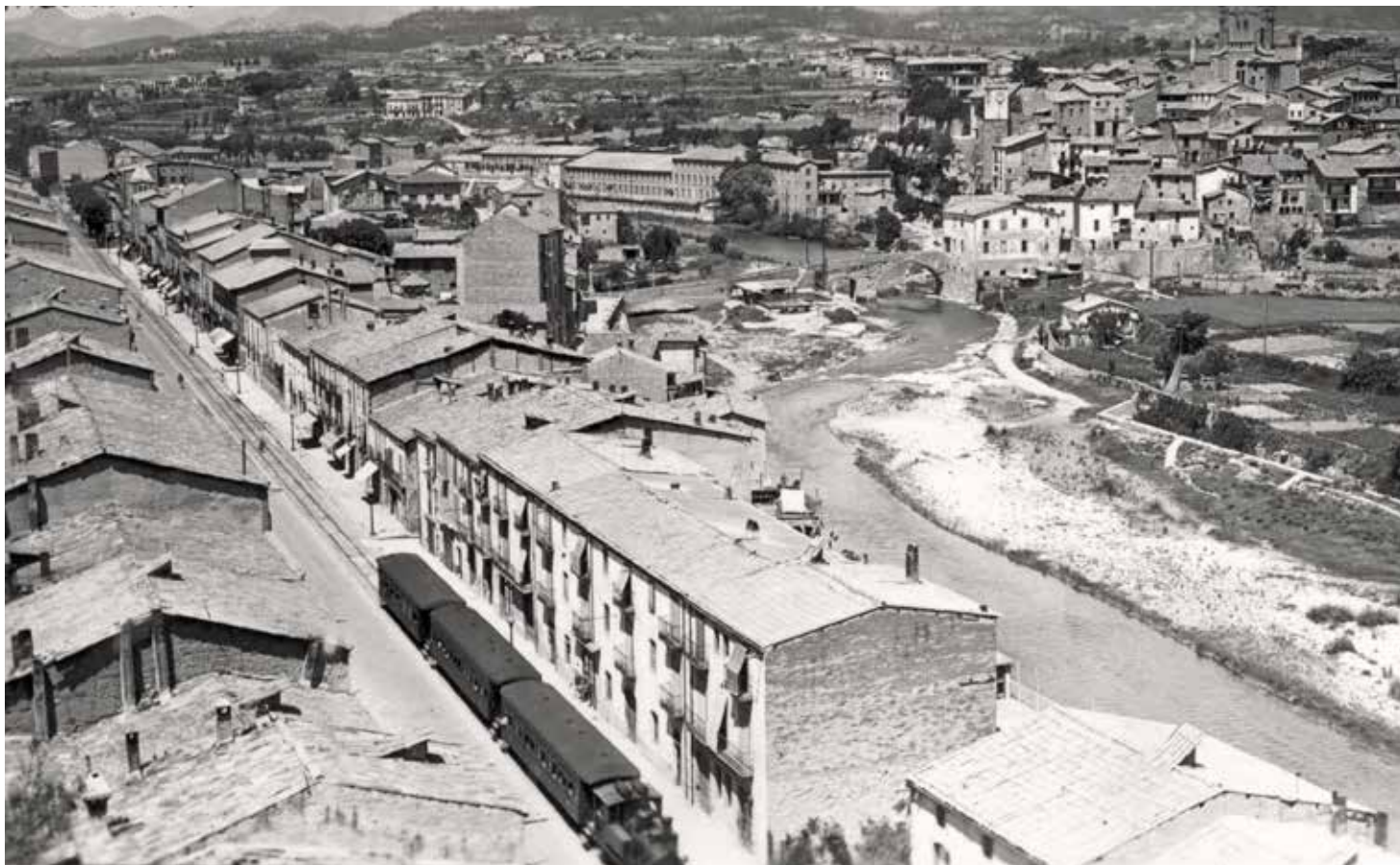
Vista general de Gironella els anys de la immediata postguerra