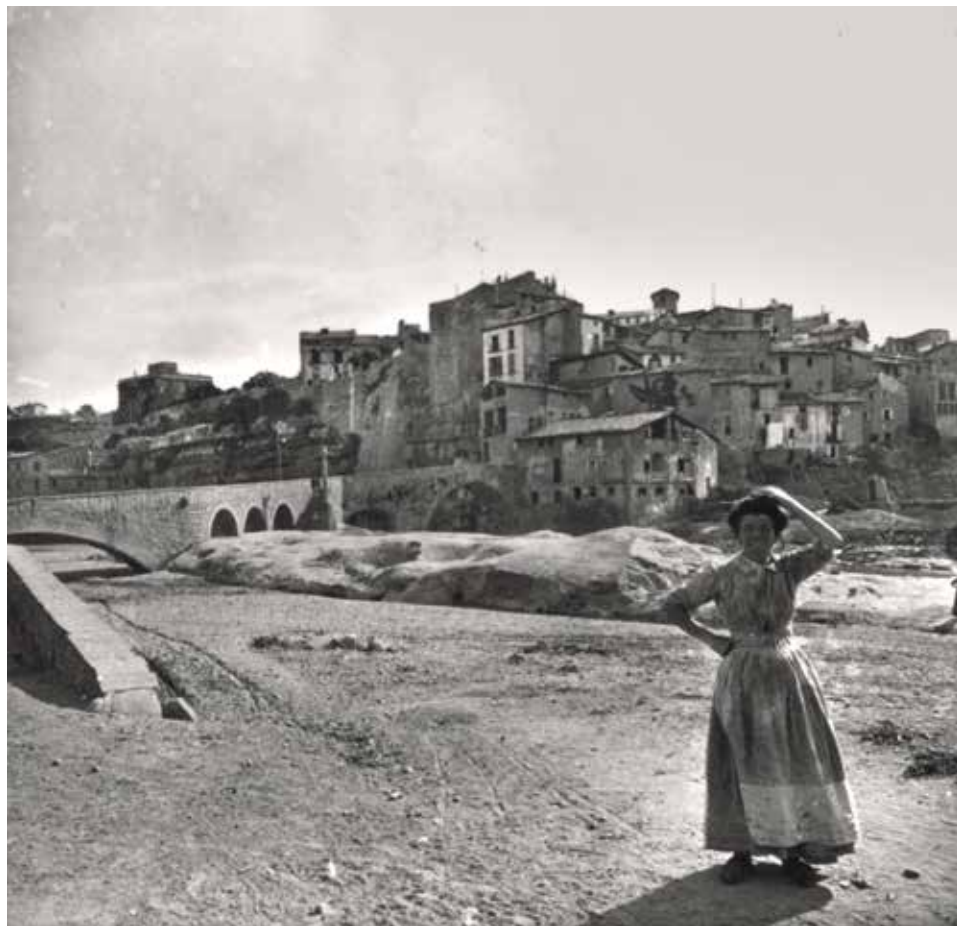
Gironella en una imatge dels anys vint on es veu l'obra del pont acabada

En aquest context hem d'encaixar l'anècdota que explica el periodista Carles Sentís en relació a un dels primers treballs perio-