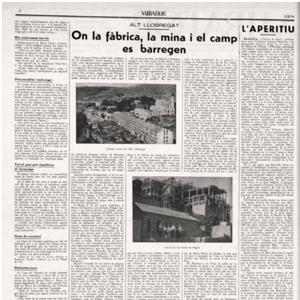
L'article de la revista Mirador on el febrer del 1936 Ramon Pei publica «ALT LLOBREGAT. On la fàbrica, la mina i el camp es barregen», amb dues imatges significatives: la colònia Pons i el rentador de carbó de Figols

demás parientes 'de pura cepa'; 'Berga y sus alrededores SA'; 'Obras por Administración SA'; sus afiliados de Castellar del Riu; Bagá; Gisclareny; Caserras y Castellar de Nuch; El Alcalde Honorario y Perpetuo de la Patagonia y todas las grandes narices afiliados al partido.