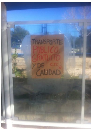
Figura 1. Carteles colgados los días antes de la huelga del 13 y 14 de abril de 2016 en la parada del centro educativo