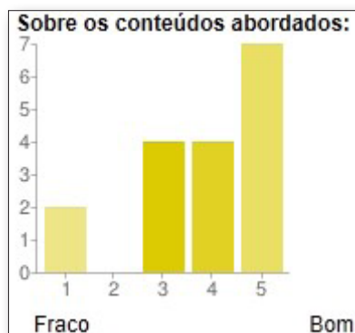
Gráfico 2: Sobre os conteúdos abordados.

O gráfico 2 apresenta a avaliação dos professores quanto aos conteúdos abordados na disciplina. É importante destacar que para um bom desenvolvimento em sala de aula o professor deve disponibilizar textos com aportes teóricos significantes, estes textos contribuem para o melhor entendimento dos alunos sobre o tema referido, entretanto, o professor deve também trazer outras contribuições para o determinado estudo.