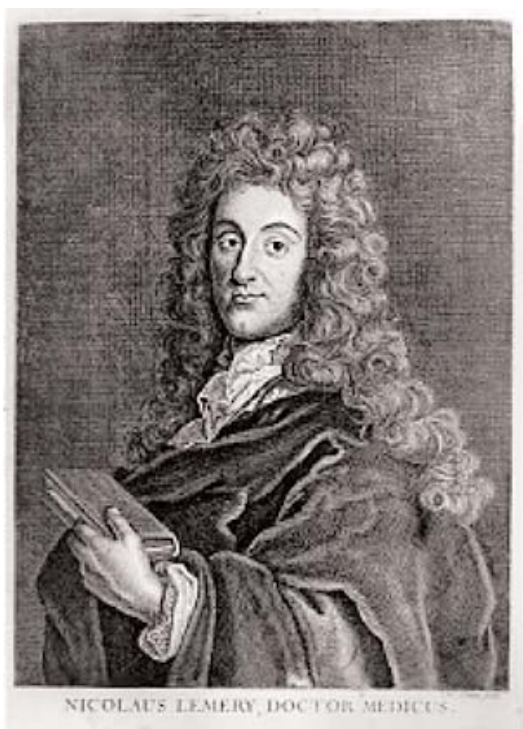
Fig. 1. Gravado representando a Nicholas Lémery.

Nicholas Lémery era un crítico del secretismo alquímico, habiendo procurado divulgar los conocimientos que poseía en el dominio de la química a un público de no iniciados. Para afrontar ese objetivo se esforzó en usar una lengua accesible, acompañando a sus exposiciones, siempre que fuera posible, con experiencias. La construcción de sus “volcanes artificiales” parece haber sido, según relatos de la época, una de las actividades que suscitaron mayor impacto e interés en el conjunto del programa de estos cursos. Pero, la vida profesional de Lémery quedó marcada también por algunos momentos menos positivos. En 1681, fruto de la creciente intolerancia religiosa que existía en Francia, Lémery fue forzado a abandonar el puesto de farmacéutico del Rey Luis XIV, y a cerrar, en 1683, su curso de química en París. La Revocación del Edicto de Nantes, en 1685, lo obligó a exiliarse en Inglaterra por un corto periodo de tiempo. Posteriormente, en 1686, abandonó el calvinismo y se convirtió al catolicismo, pudiendo a partir de ahí retomar las lecciones de sus cursos. En 1699, tuvo uno de los momentos más altos de su carrera, convirtiéndose en miembro de la Académie Royal des Sciences de París .