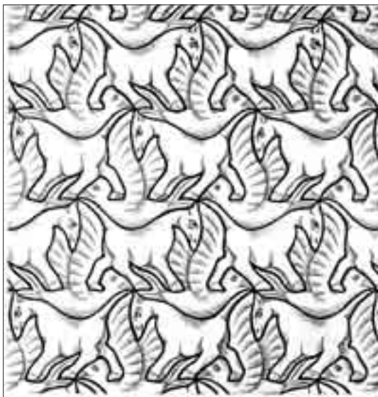
Figura nº 1.- Conjunto bidimensional repetitivo. De un dibujo de M.C. Escher.

1.- En la figura nº 1, vemos un dibujo repetitivo en el que pueden apreciarse relaciones de simetría. Se trata de un dibujo del pintor M.C. Escher. A partir de estos dibujos periódicos que representan una realidad repetitiva bidimensional, se establece el modelo abstracto de referencia que es el RETICULO CRISTALINO. Para ello el estudiante debe superponer sobre el dibujo un papel vegetal, en el que irá marcando puntos de referencia para establecer la distribución de puntos ordenados que representa el dibujo periódico. Las características que definen el retículo son: