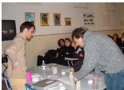
Fig. 6. Docentes siendo informados acerca de las actividades de AprendeideaTierra en Italia a principios del 2009.