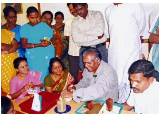
Fig. 5. Docentes trabajando las actividades de AprendeideaTierra en la India a fines del 2008.