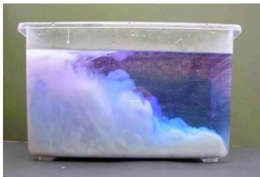
El modelo en funcionamiento

Tema: Se muestra como fluyen las corrientes de densidad en el seno del agua contenida en un recipiente, y se analiza la analogía con la atmósfera y el océano.