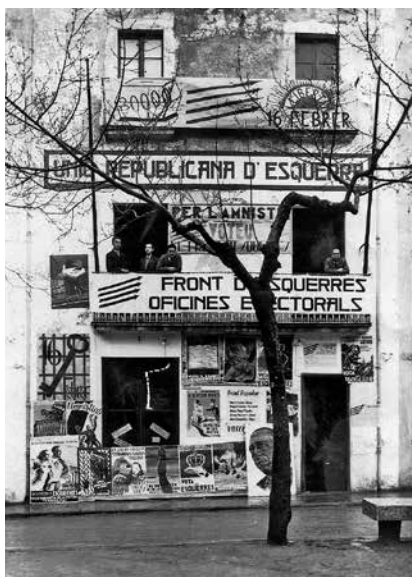
Fig. 2. Seu del Front d'Esquerres en les eleccions del 16 de febrer de 1936. Autor: Ramon Tauler.