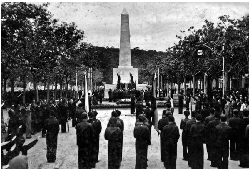
Fig. 15. Obelisc muntat al passeig de mar amb motiu de la Fiesta de la Victoria.

més d'inquietud i d'angoixa que es viva a la rereguarda ganxoana. El fet és que les condicions de vida dels veïns i refugiats que s'instal·laren a la nostra ciutat van sofrir un empitjorament gradual a mesura que passaven els mesos. Els lectors del dietari de Lluís Llor en aquest treball podran observar que l'autor remarca més la inquietud per l'escassetat d'aliments i de tabac, el problema de les subsistències, la manca de queviures, de medecines i d'energia (llenya, carbó, llum, etc.). Una situació tan precària afavorí l'augment de la mortalitat a causa de les malalties, especialment la tuberculosi i el tifus.