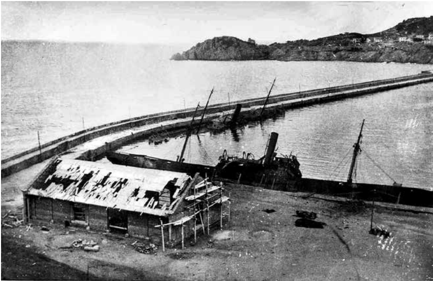
Fig. 10. Tinglado. El moll objectiu dels bombardejos.

Del carbón vegetal, que fabrica el Gas local que antes se expendía a 8 pts los 40 kilo hoy se vende a 36 pts. Las avellanas tostadas se expenden a 4 pts. los 400 gramos.