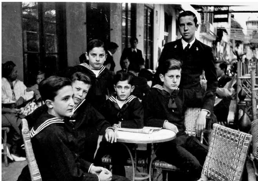
Fig. 8. Nens refugiats al Marina.

[Noviembre] 16. A las 7.30 mañana toque repetido de sirena, cesando el peligro a las 8.15 mañana.