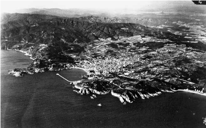
Fig. 1. Vista aèria de Sant Feliu l'any 1935.

Les generacions vives ens sustentem en allò que van construir i van aconseguir els nostres avantpassats. Vivim del seu llegat, ens nodrim de la cultura i el saber que ells van construir. Així, doncs, veiem la importància que té la memòria. Si la perdéssim, perdriem la nostra personalitat. Col·lectivament, també. La història d'un grup humà és la seva memòria col·lectiva i compleix respecte d'ell la mateixa funció que la memòria personal en un individu: donar-li un sentit d'identitat que el fa ser ell mateix i no un altre.