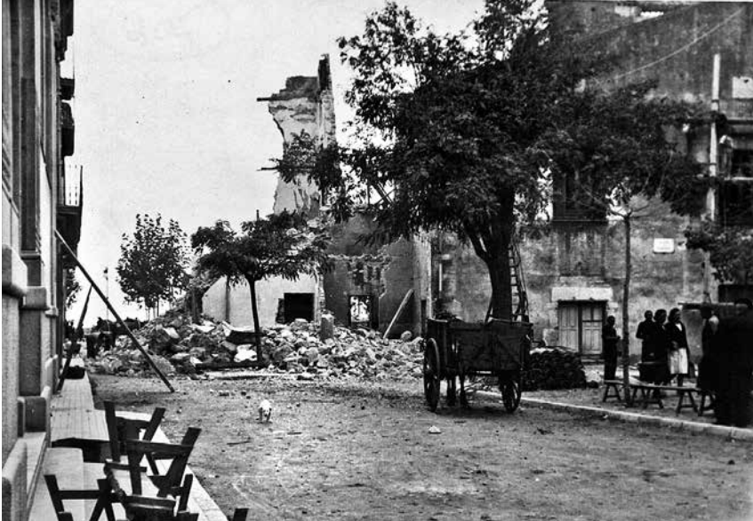
Fig. 9. Estat de l'edifici de l'ajuntament abans de bastir-n'hi el nou.

Lo particular del caso es que no se ha dado señal de alarma, de sirena, no obstante verse los aviones sobre la ciudad. Lo cual ha merecido protestas del vecindario por semejante negligencia de los encargados de ello.