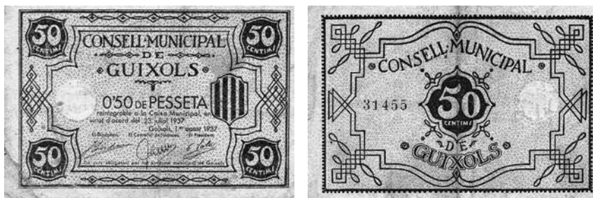
Fig. 7. Moneda de paper emesa pel Consell municipal de Guixols l'any 1937.

Agosto 14. A las 6 tarde todo el comercio por orden gubernativa ha cerrado sus puertas en señal de duelo y protesta por el bombardeo referido.