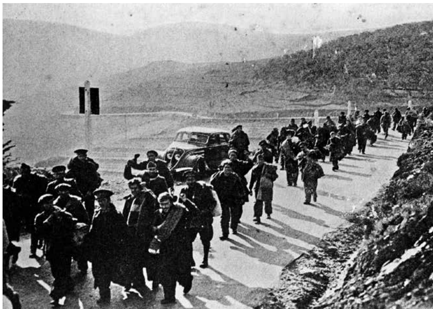
Fig. 13. Camí de l'exili. Editor: Estudio Chauvin. AMSFG.

acompañarlos los camiones que llevan subsistencias a causa de haber hallado destruido todos los puentes de la carretera de Tossa a esta ciudad que mañana serían reformados y vendrían con el resto de la columna, pues su intención era ir a primeras horas de la madrugada a Palamós y poblaciones que siguen hasta llegar a unirse con las fuerzas que hace pocos días fueron desembarcadas en Port-Bou para cercar la frontera y poder realizar el plan liberados absoluto de la provincia de Gerona. ¿ papel moneda de Italia y de España franquista y al hablar de Italia ponderaron su gran patriotismo por Mussolini a quien profesaban una gran admiración, respeto y simpatía por ser el hombre del siglo, de la paz y del derecho. A las 12 de la noche buena parte del vecindario se fue a descansar, pasándose la noche tranquila excepción hecha de algunos robos en tiendas u casas particulares.