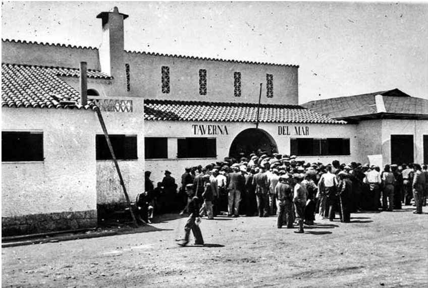
Fig. 12. La Taverna del Mar, Sant Pol, escenari de l'homenatge als Brigadistes Internacionals.

mueztos aquí, saliendo la comitiva de los paseos del Mar frente Casino La Constancia y desfilando por la Rambla Vidal, calles Hospital y plaza Monasterio. El alcalde C. Sala dedicó algunas palabras al referido homenaje póstumo. Por la R. Vidal y calle... había grandes pancartas con inscripciones alusivas a la despedida de los Internacionales para que recordaran en sus respectivos países el gesto obrero español en la contienda actual etc., etc.