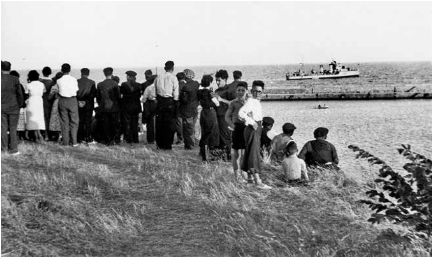
Fig. 5. Un creuer anglès recull els ciutadans del seu país.

Han sido incautadas todas las embarcaciones de pesca y sus utensilios y productos que pasan a una Comisión administrativa que paga a cada pescador 56 pts. semanales y unas partes a los dueños de lo que se coge bajo determinadas condiciones.