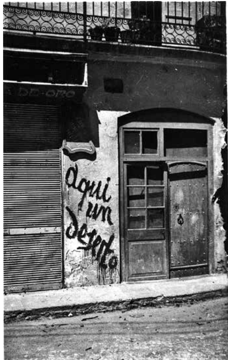
Fig. 11. Alguns edificis de guixolencs coneguts varen ser assenyalats amb la paraula “desertor”.

Entre particulares 1 kilo de arroz, alubias, garbanzos, pan, se cotiza en 30 pts. 1 kilo de harina de maíz en 20 pts.