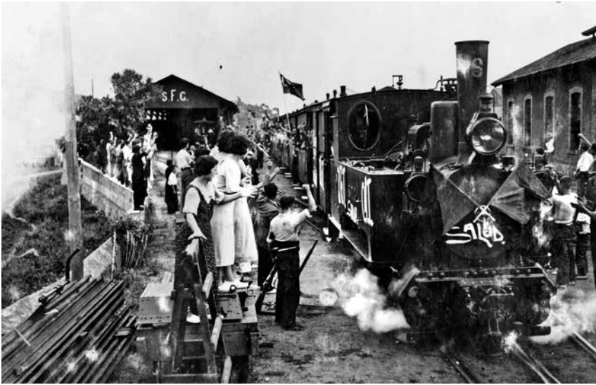
Fig. 6. Milicians guixolencs i de la comarca es dirigeixen al front.