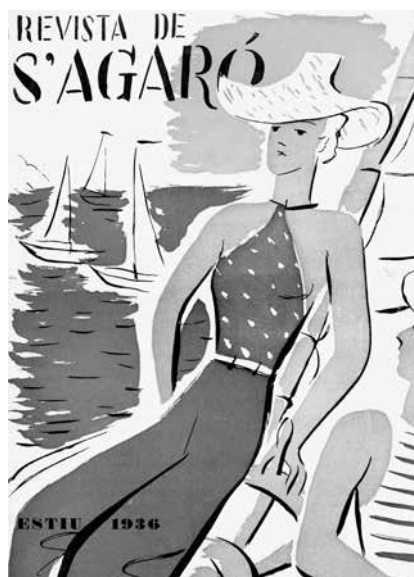
Fig. 3. Portada de la Revista de S'Agaró . Estiu de 1936.

més d'una vegada, del Casino dels Nois. Políticament, es reconeixia republicà, i s'havia presentat en unes eleccions municipals com a representant del Partit Radical. Segons ell mateix, va començar l'any 1899 a simpatitzar amb els ideals republicans.