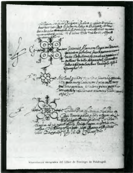
Reproducció fotogràfica del llibre de Privilegis de Palafrugell.

El Llibre de Privilegis era així el còdex on es recollia la personalitat jurídica de Palafrugell i tenia un gran valor per la vila, la qual cosa es pot apreciar en la cura amb què es va elaborar. Els 48 folis manuscrits de 29 per 22 cm eren relligats i protegits amb cobertes de cuir, en les quals figuren l'escut de Palafrugell i la creu del Priorat de Santa Anna. Segur que tenia un lloc preferent a l'arxiu del comú a l'església, on es guardava amb pany i clau.