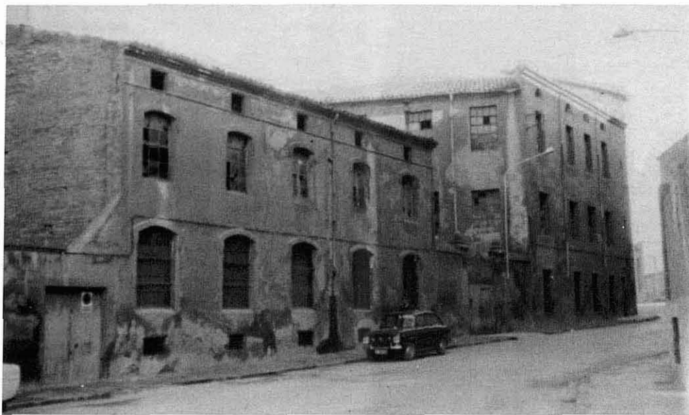
Fàbrica de cal Serrano poc abans de desaparèixer 28