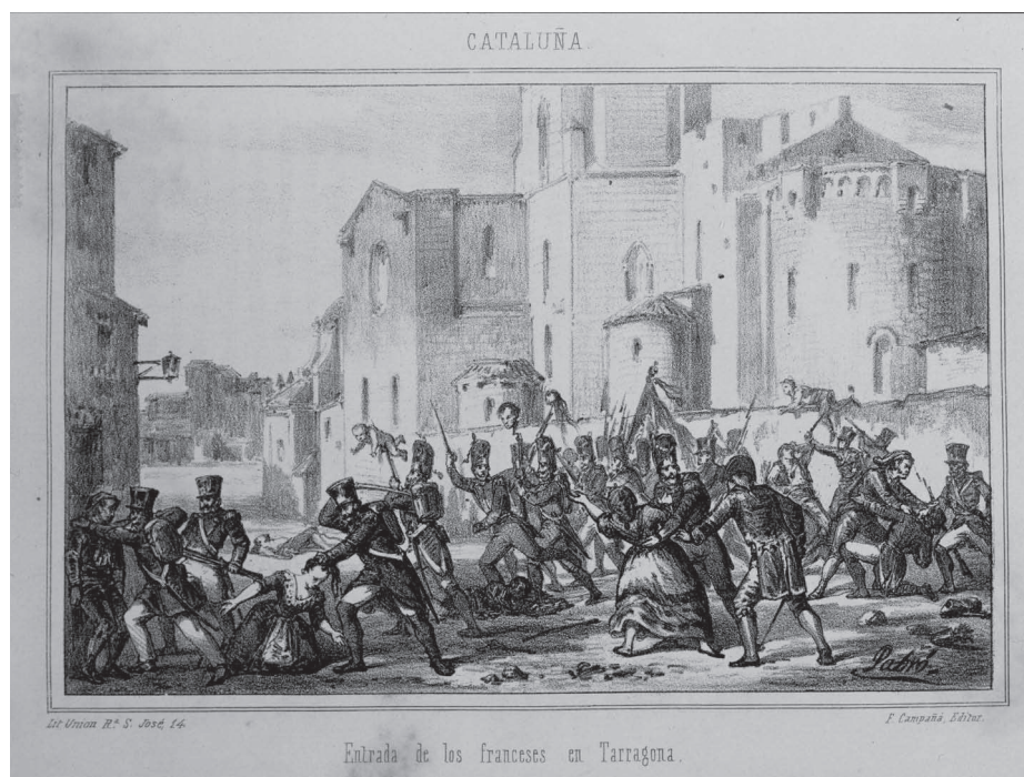
Fig. 2. Entrada dels francesos a Tarragona, a Adolfo Blanch i Joaquín Roca y Cornet (ed.): Cataluña: historia de la guerra de la independencia en el antiguo principado . Impr. y Libr. Politécnica de Tomás Gorchs, Barcelona 1861.

La matança del 28 de juny de 1811, dia de l'assalt final en el qual els francesos aconseguen penetrar a la plaça de Tarragona i ocupar-la, donant inici a un saqueig dramàtic, es va cobrar la vida d'un important nombre de constantinencs. El rector en deixà testimoni escrit en una nota al marge del llibre d'òbits: