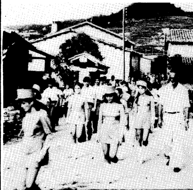
Les majorettes trepitjant sobre rocs.