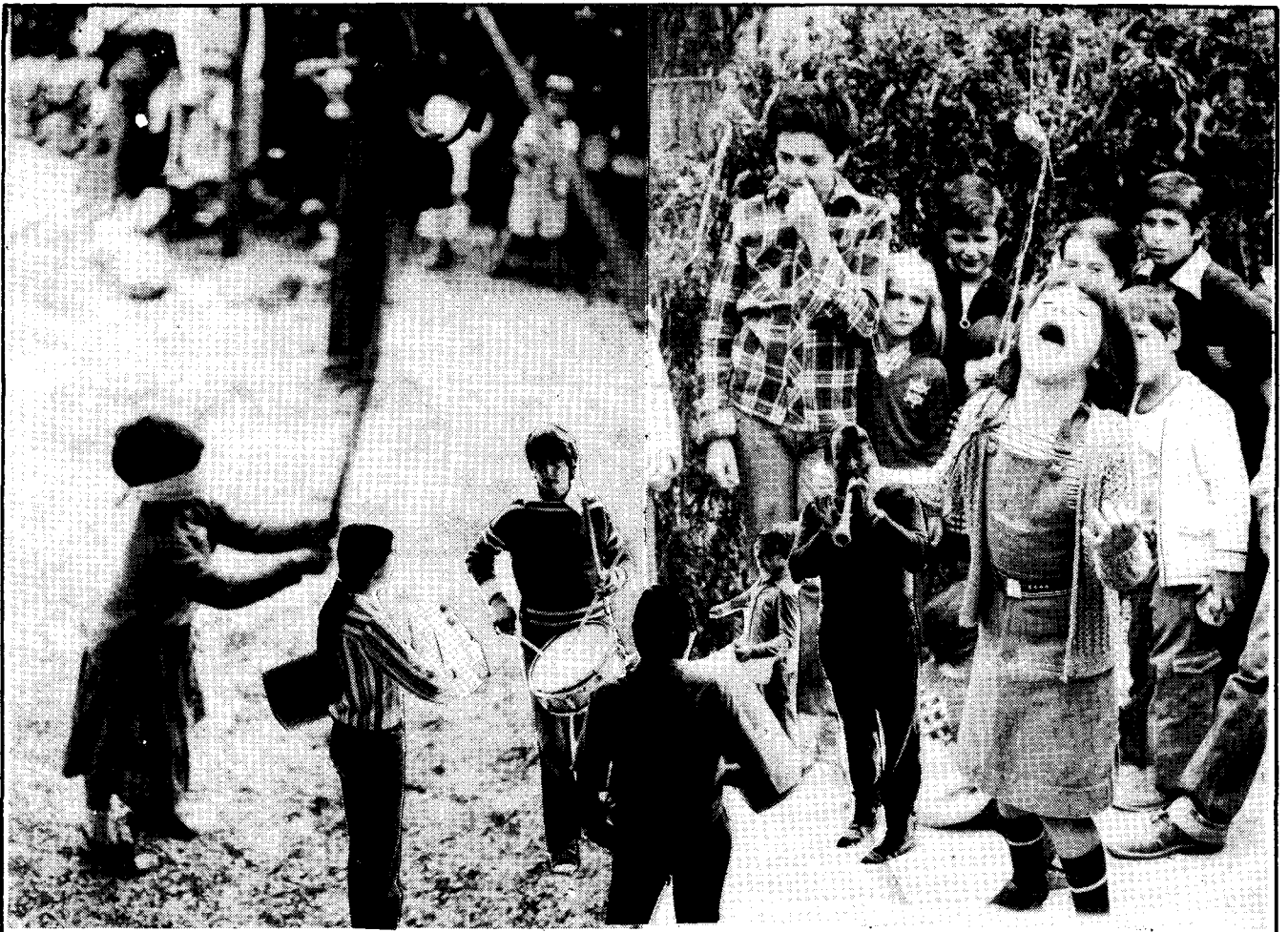
Uns jocs de cucanya que van agradar a tots els nois malgrat la seva improvisació.