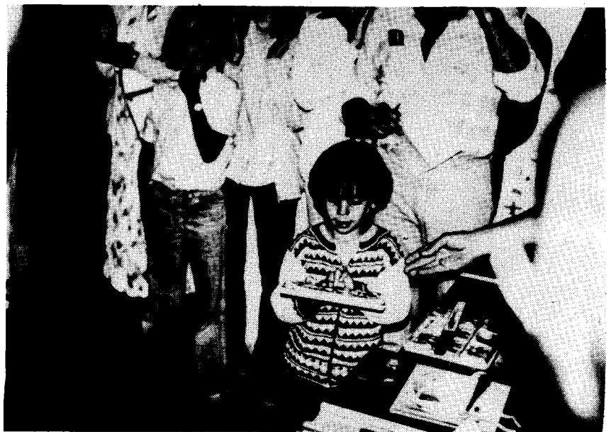
Entrega de premis al concurs de pintura ràpida.

només va assistir a la ballada de sardanes, fins el qui va participar activament en tot el que es va fer. Cadascú té els seus gusts, per això cal fer les coses tan al gust de tothom com sigui possible i ben variat per poder escollir. Es creu -però- que s'hauria d'aconseguir