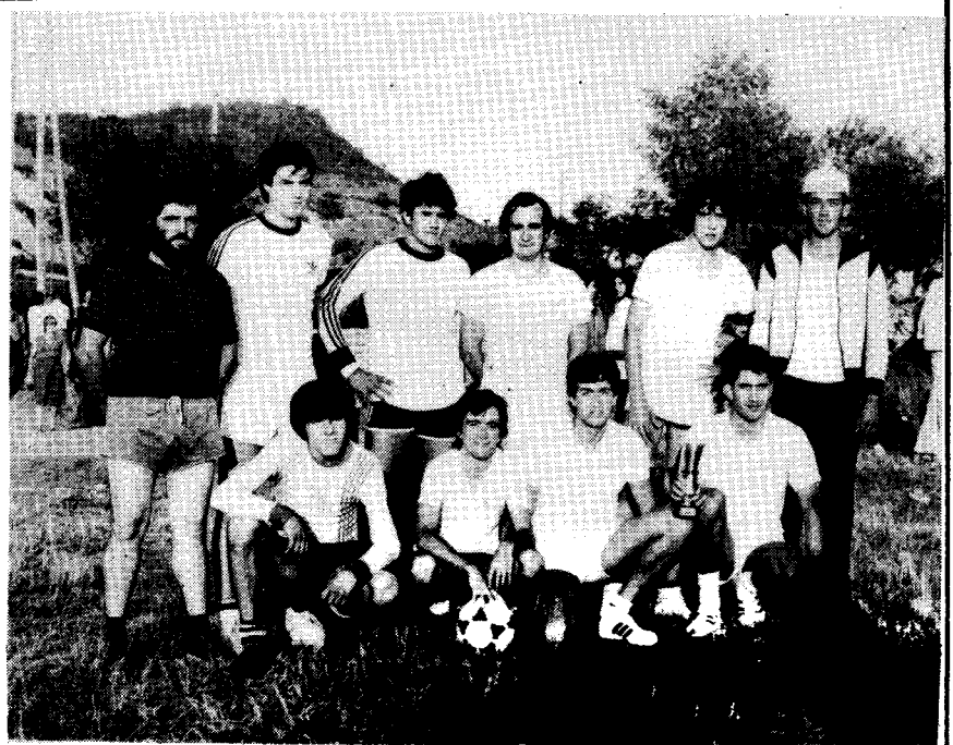
Per primer cop en molts anys, els solters van guanyar per .... 7 gols a 4 dels casats.

El ball va semblar bé a tots aquells que els hi agrada. Als que no els hi agrada no hi van participar. S'ens ha comentat que la majoria de festes majors centren l'activitat