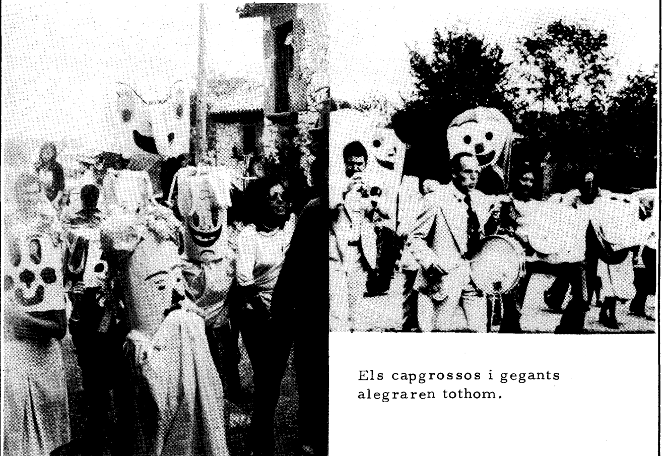
Els capgrossos i gegants alegraren tothom.