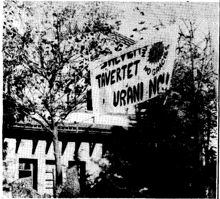
"No a l'urani", i al fons l'ajuntament amb una gran bandera espanyola que sortosament va ésser retirada a temps.