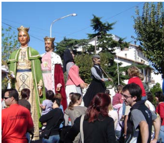
La plantada de gegants de l'Esquirol i Tvertet va donar a la Fira un ambient festiu.