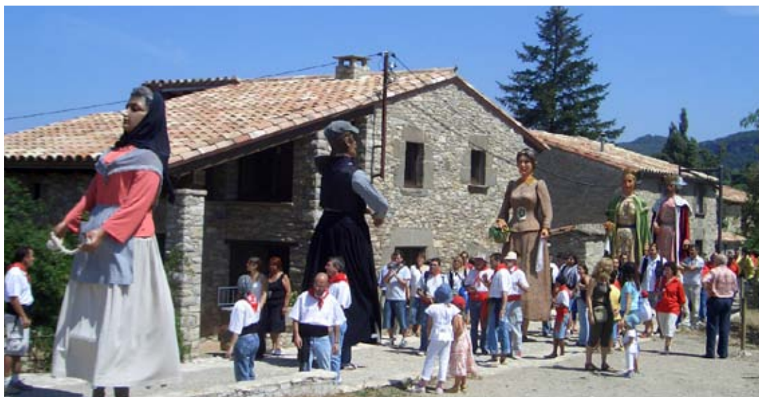
La cercavila a la Trobada de Gegants a Tavertet