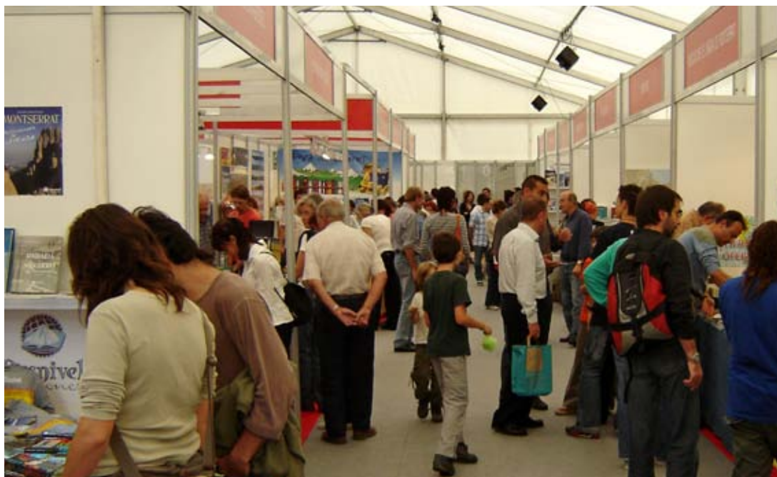
Els estands de les editorials a l'interior de la carpa.