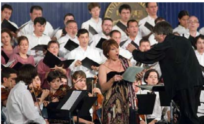
Inauguració del XXV Festival de Música de Cantonigròs amb un concert amb orquestra i la veu de la soprano Maria Bayo.