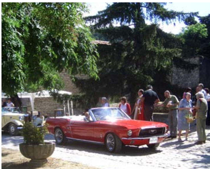
La tradicional benedicció de cotxes per Sant Cristòfol, patró de Tavertet.