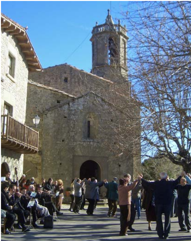
Sardanes a la Festa Major de Pruit.

El passat dia 29 de novembre, festa de Sant Andreu, es va celebrar la Festa Major de Pruit. A les dotze va haver-hi l'ofici solemne seguit d'una ballada de sardanes. L'Associació de