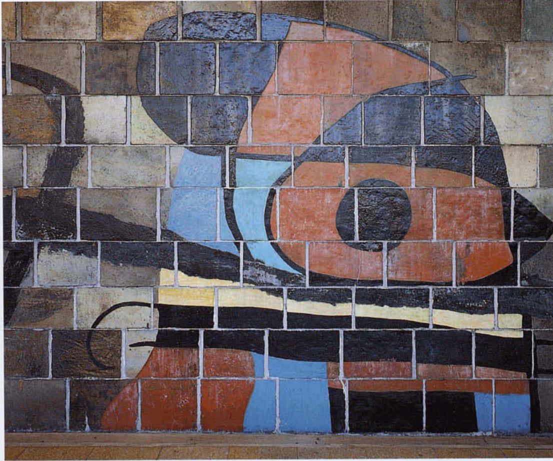
FRAGMENTO DEL MURAL "EL SOL I LA LUNA". UNESCO, PARIS