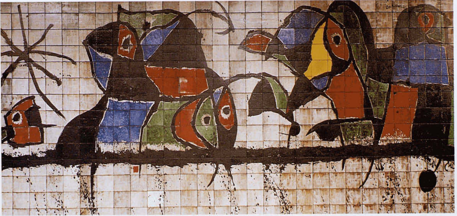
MURAL DE IBM. BARCELONA