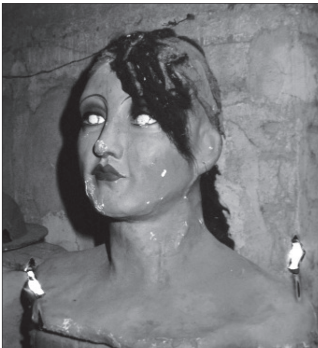
El cap de la Maria, trobat a les golfes de Can Miravitges, l'any 1985 en un estat molt deplorable.

Malauradament, a l'any següent, després de celebrar la Segona Trobada de Gegants a la nostra ciutat, van patir un