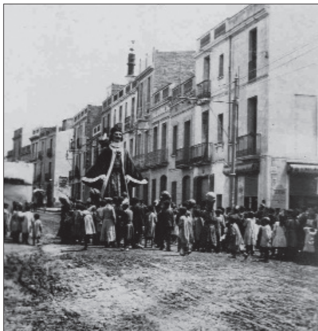
Els gegants i els nans recorrent l'antic carrer del Rabal, encara sense empedrar, a mitjan anys 1910. Museu de Badalona. Arxiu Josep M. Cuyàs Tolosa.

En el ple celebrat el dia 27 de juny de 1913, a petició de la Comissió de Foment, es va acordar procedir novament a la reparació de les figures i a l'adquisició d'uns nous vestits més escaients. De fet, la indumentària sempre va seguir la mateixa