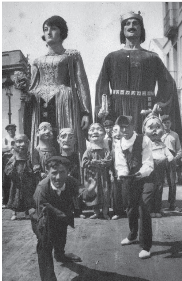
L'Anastasi i la Maria al carrer d'Enric Borràs, davant de l'església de Sant Josep, l'any 1928. Destaca el nou pentinat i el vestit de la geganta.