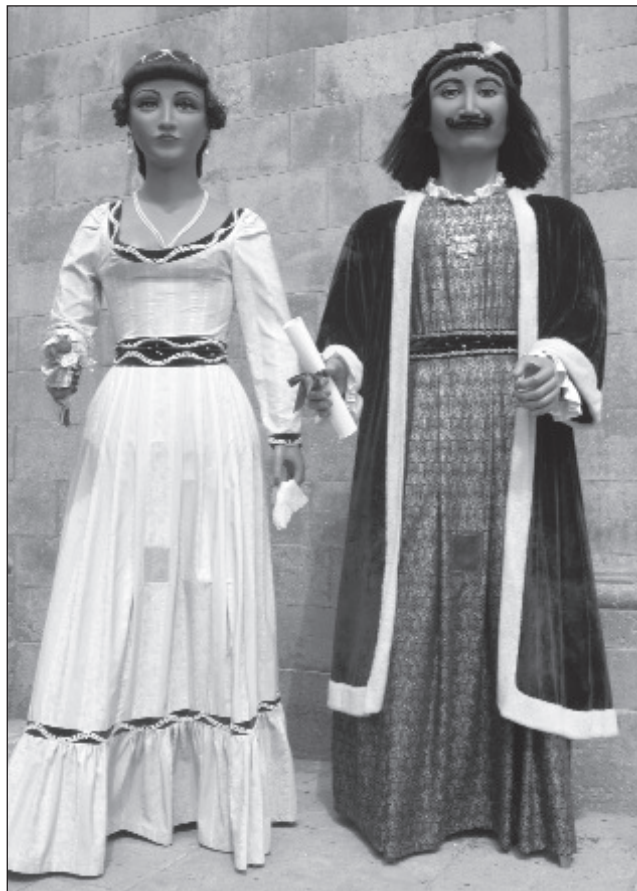
Els gegants centenaris amb l'aparença actual, davant de l'església de Santa Maria, el 2009.

seva recuperació el 1986, els gegants també ballen el Valset de Badalona , amb música composta per Jordi Fàbregas i coreografia de Jan Grau.