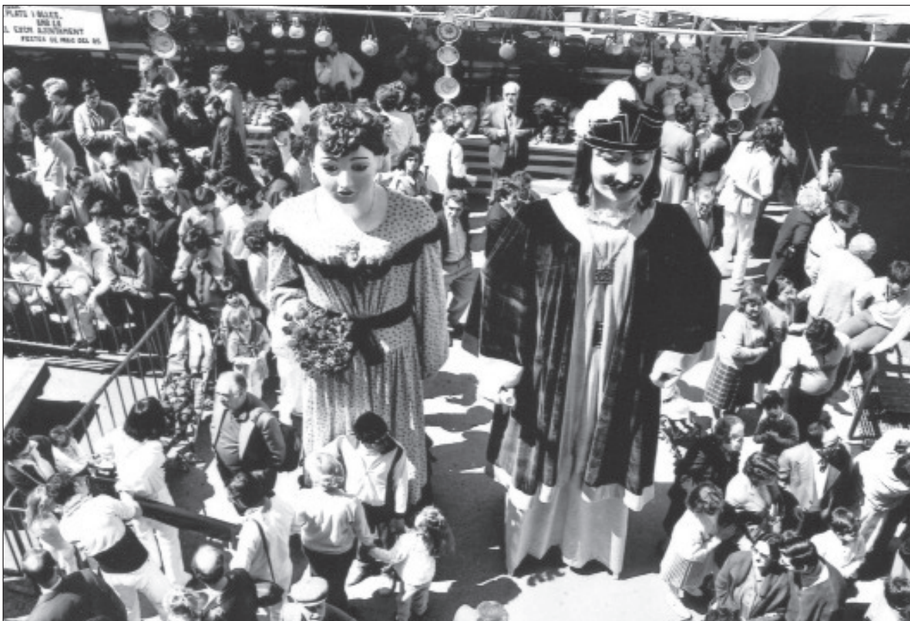
L'Anastasi i la Maria el dia quan es van estrenar, el 12 de maig del 1985, a la plaça de la Vila.

Pel maig del 1998, els gegants Anastasi i Maria van celebrar solemnement els 140 anys, envoltats d'altíssims amics vinguts de tot el país.