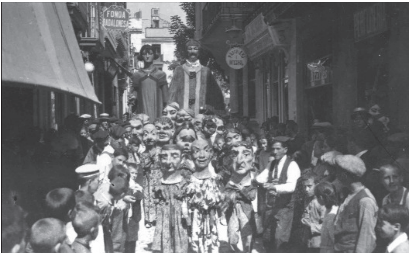
La comitiva festiva al carrer de Mar, a la primera meitat dels anys 1920. Entre els capgrossos, podem observar en Patufet.

Excepcionalment, el 1917, la gran festa d'agost es va haver d'ajornar fins als dies 7, 8 i 9 de setembre a causa d'una gran vaga general, de molt ressò a Badalona, però sense incidents greus. L'any següent sembla que la geganta va estrenar un vestit nou de color groc.