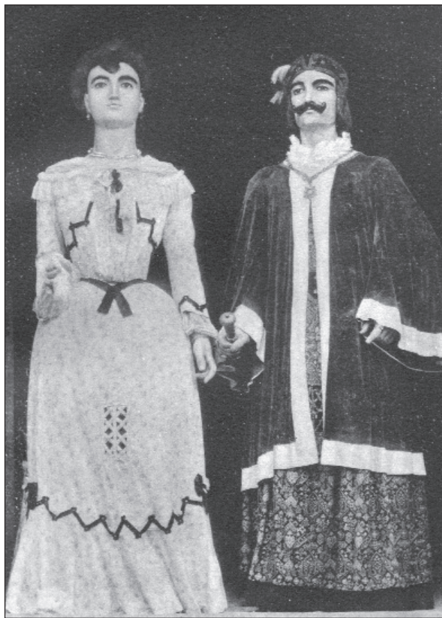
Imatge dels gegants de Badalona l'any 1902, extreta del llibre Gegants, nans i altres entremesos , de Joan Amades.

castell de Santa Florentina de Canet de Mar, que es va endur la medalla d'or i 1.000 pessetes pel seu bon gust artístic.