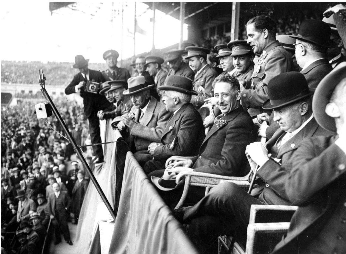
Casas a l'estadi de Montjuïc fotografiant Alcalá Zamora, Macià i Companys, el 27 d'abril de 1931.

Durant aquests anys, la càmera de Casas recollirà els principals fets de l'agitada vida política catalana. La vaga general de 1930, el retorn de l'exili de Francesc Macià, la proclamació de la Segona República o la redacció de l'avantprojecte d'Estatut a Núria van ser, entre altres notícies de l'època, objecte de la fotografia d'aquest autor.