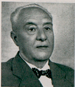
Gaziel, un dels mestres del periodisme català

placa commemorativa a l'Hotel Avenida Palace de la capital on va viure el periodista català per escriure la seva obra Portugal enfora . Gaziel va aprofundir en la idea de la "diversitat ibèrica amb inquietuds cosmopolites" El periodista "va tenir el món com a horitzó, sense oblidar la seva voluntat de servei a Catalunya", segons Antich.