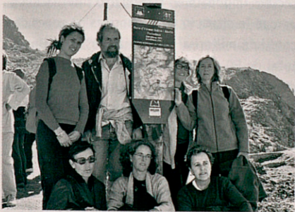
Una imatge de l'excursió en memòria d'Udina

Es col·loca al cim del Montseny de Pallars Jussà (2.883 metres) una placa a la memòria del periodista i escriptor Ernest Udina que fou coordinador del Centre Internacional de Premsa de Barcelona (CIPB), secretari de l'Associació de Periodistes Europeus de Catalunya i gran aficionat als esports de muntanya. Udina morí el 5 de juliol de 2001 en el descens del Montblanc després d'haver fet el cim. A l'homenatge assisteixen familiars i companys del Col·legi de Periodistes i del CIPB.