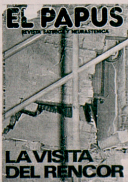
Portada d'El Pápus després de l'atemptat

Es compleixen 25 anys de l'explosió d'un artefacte a la seu de la revista El Pápus que va costar la vida al conserge de la publicació i va ferir diverses persones que es trobaven a l'edifici a la plaça Castella de Barcelona. Els autors de l'atemptat, comès per una organització ultradretana, van ser condemnats l'any 1983 a diferents penes de presó. Les víctimes i els seus familiars no van cobrar les indemnitzacions que la condemna obligava a pagar als terroristes que es van declarar insolvents.