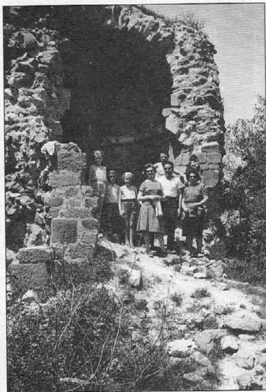
Església de Sant Cebrià de Cabanyes l'any 1965

Alguna vegada, segons l'època de l'any, havia vist pels voltants de Cabanyes i el Pi del Candelero, uns monticles dels quals hi sortia fum. Em van explicar que feien carbó de les branques que tallaven dels arbres i dels arbustos del sotabosc, ho amuntega-