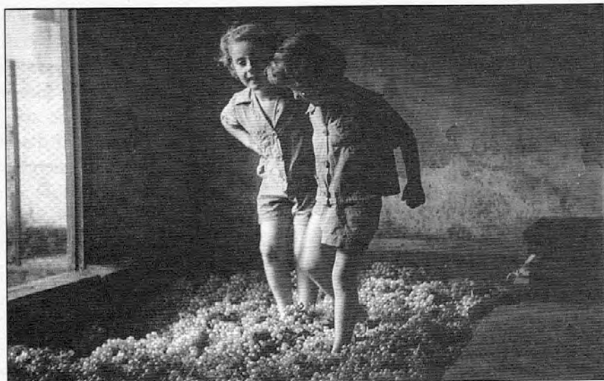
Trepitjant raïm, l'any 1959 a Can Pau

cara bruta de la quitxalla i els de la colla, que eren del poble, deien que tenien « cara de setembre ».