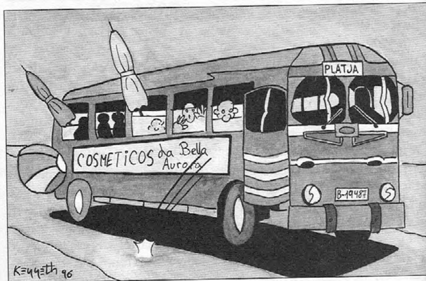
L'autobús Badalona-Sabadell ple per anar a la platja (Dibuix d'en Kenneth Figuerola)

Per la carretera de Mollet a Badalona hi havia poc trànsit. La Derbi usava la carretera com a pista de proves. Els qui provaven les motos anaven i tornaven de la Derbi a la Conreria. A alguns dels que provaven les motos, en passar per Sant Fost els esperava a la carretera una minyona o noia de servei, d'alguna família d'estiuejants, i que tenia festa aquella tarda, pujava la noia a la moto i marxaven junts. No sé pas quin