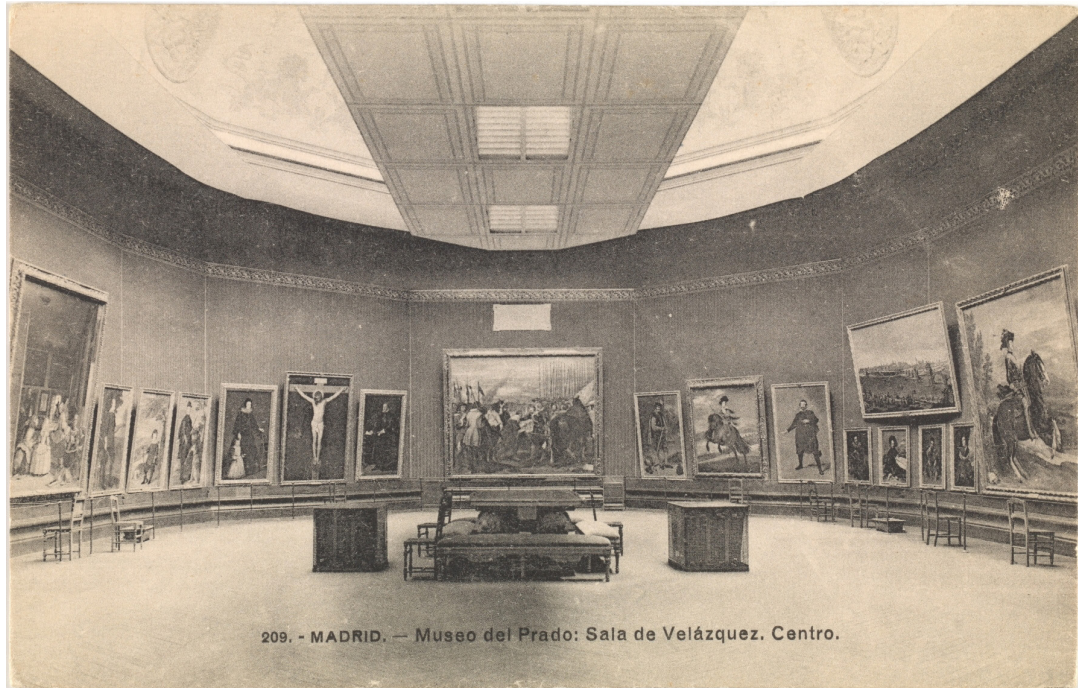
FIGURA 5. José Lacoste, Vista de la sala Velázquez ca. 1910, Fototipia sobre cartulina. Museo del Prado.

deixat aquest lloc singular i era disposat a la sala de Velázquez, a la zona lateral esquerra, entrant des de la galeria central (fig. 5). Avui, Las Meninas ocupen l'eix frontal de la sala, mentre que aleshores hi havia penjat, en aquest indret presidencial, La Rendició de Breda . Villegas, durant la seva etapa de director del museu, va modificar a fons l'estructura de presentació de les col·leccions, tal com ja recull el catàleg de 1910. 7 Tenim a més un conjunt de vistes fotogràfiques de les sales fetes per José Lacoste, que ens permeten conèixer la major part del muntatge de les sales que va veure Martinell a la seva primera visita de 1913. 8