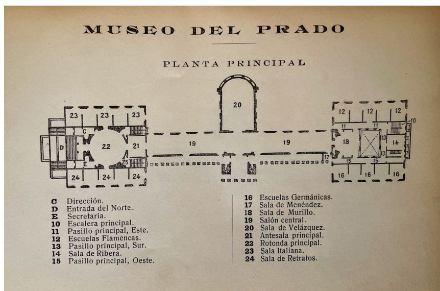
FIGURA 3. Esquema de la planta principal del Museo del Prado, publicada a Catálogo de los cuadros del Museo del Prado por don Pedro de Madrazo , Imprenta y fototipia de J. Lacoste, Madrid 1910.