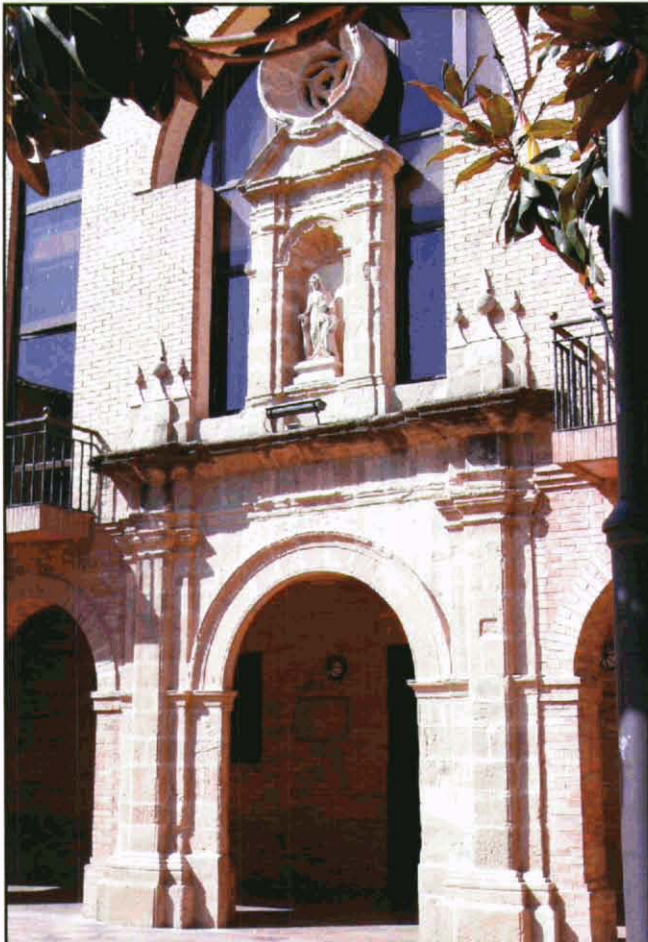
Portal de la capella de Sta Anna avui a la façana de l'Ajuntament