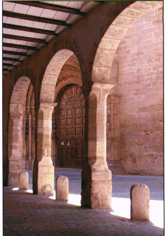
Lo perxe de davant de l'Església