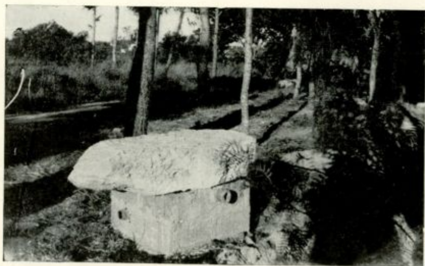
Pórpuras. Elementos de construcción romanos extraídos de la mina