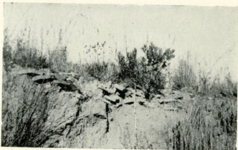
Pórpuras. Escombrera del horno cerámico