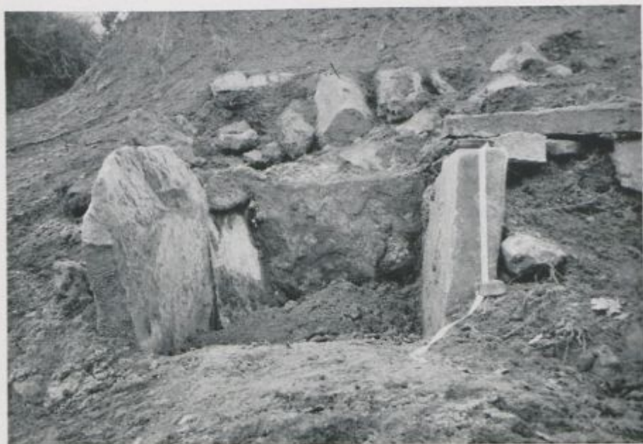
Sepulcro prehistórico en Conesa