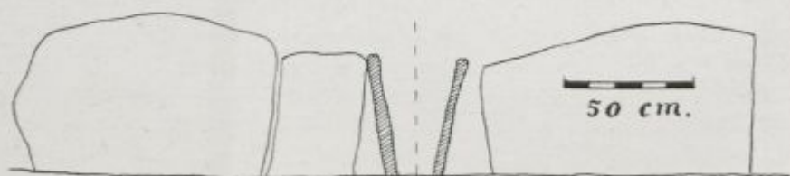
Sepulcro prehistórico de Conesa. Planta y alzado bilateral