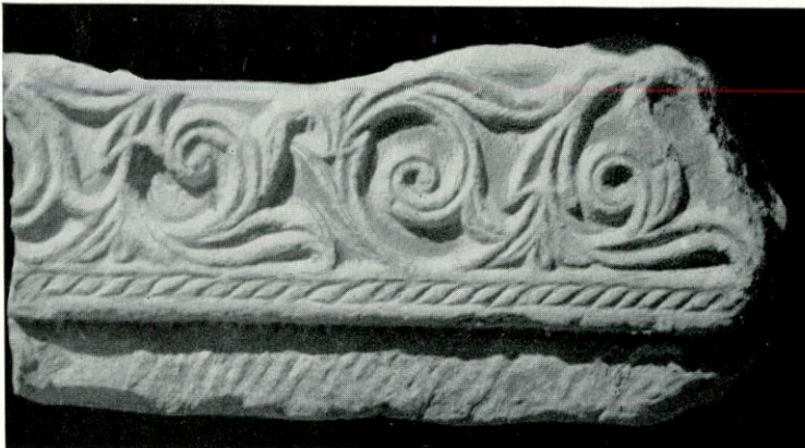
Detalle de la imposta hispanovisigoda mostrando en su parte inferior el picado característico.