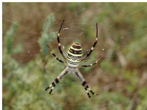
Fig. 4. Hembra de Argiope bruennichi en la isla Columbrete Grande.

Fig. 4. Female Argiope bruennichi in the island Columbrete Grande.