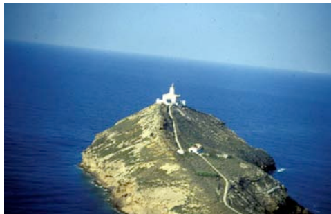
Fig. 2. Detalle del camino central de la isla Columbrete Grande en donde se realizaron los censos.

Fig. 2. Central path in the island Columbrete Grande where censuses were conducted.