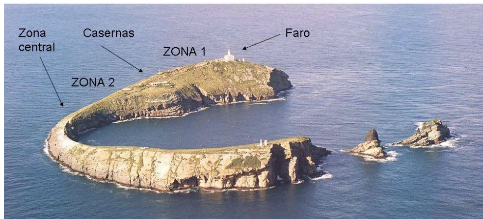
Fig. 1. Zonas de muestreo en la isla Columbrete Grande del Parque Natural de las Islas Columbretes (Mediterráneo, España). Zona 1: desde el Faro hasta las Casernas; zona 2: desde las Casernas hasta el camino en el centro de la isla que baja al puerto.

Los censos de arañas se han realizado en dos zonas de la mitad Norte de la isla, entre el Faro principal y el puerto (Fig. 1). La zona 1 conecta el Faro con las Casernas de ocupación humana, y la zona 2 conecta las Casernas con la zona Central que conduce al desembarcadero de la isla. Los censos se han realizado en agosto de 2007 y 2008 en las mismas zonas y por las mismas personas que los años anteriores (Castilla et al. , 2004; 2005; 2006). Durante los censos se avanzó a paso lento cubriendo ambos lados del camino de un metro de ancho