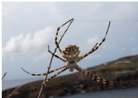
Fig. 3. Hembra de Argiope lobata en la isla Columbrete Grande.

Los censos fueron realizados simultáneamente por dos personas caminando en paralelo a lo largo del recorrido. Se anotó el número de arañas observadas de cada especie, A. lobata (Fig. 3) y A. bruennichi (Fig. 4) y su distancia al camino. La presencia de arañas adultas no pasó desapercibida ninguno de los años de estudio debido al gran tamaño de las telas (entre 1 y 3 metros de longitud) y al visible tamaño corporal de las hembras de cerca de 2 cm, que además se encontraban en posición estática en el centro de la tela. Por ello, consideramos que las diferencias entre