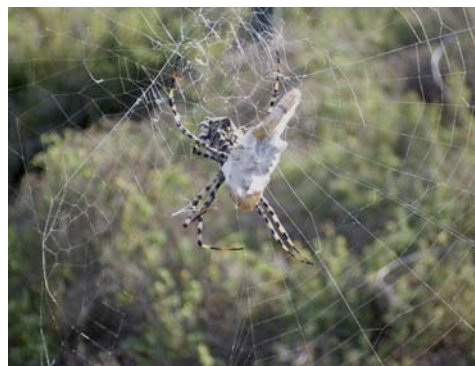
Fig. 5. Hembra de Argiope lobata durante el proceso de captura de una presa de gran tamaño.

La especie de lagartija endémica de Columbretes ( Podarcis atrata ) es fundamentalmente insectívora (Castilla et al. , 1997). En verano tiene lugar la explosión de nacimientos de lagartijas, coincidiendo con la época en la que las arañas alcanzan su máximo tamaño. Las enormes telas de 1 a 3 metros que construyen las especies de Argiope podrían constituir trampas muy eficaces para las lagartijas recién nacidas con una longitud