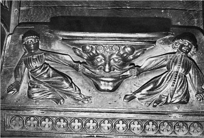
Catedral de Barcelona. Misericòrdia del cadirat alt

que la col·laboració entre Sanglada i Marata fou estreta i que d'alguna manera posaren en comú les experiències adquirides en altres contrades. Al cap i la fi, ells havien pogut viatjar a un dels llocs més privilegiats d'Europa en termes artístics, el ducat de Borgonya, bressol, juntament amb París i Berri, del gòtic internacional. 61