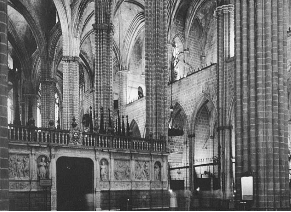
Catedral de Barcelona. Interior des del rerecor

La llarga presència de Bernat Roca com a mestre de la seu, fins al 1388, li hauria permès dirigir tasques prioritàries, com ara el cobriment dels diferents trams de la nau principal des del creuer fins a l'alçada del rerecor, un canvi de criteri a la zona de les tribunes, com també la construcció del creuer i les noves torres. 7