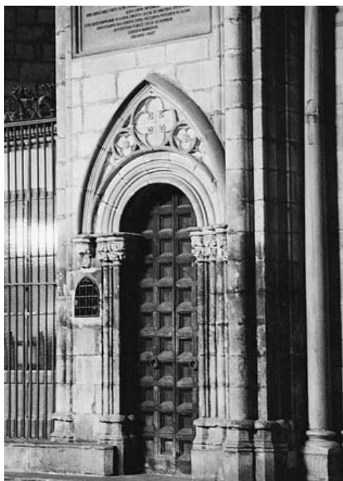
Catedral de Barcelona. Portalet del claustre al costat de la porta romànica

litzada, just al costat de la coneguda com a porta romànica i de la torre de les campanes. 68 En un altre moment ja vam fer la valoració d'aquesta porta de traçat modest que, si fos la realitzada per Marata, no es trobaria entre les seves obres més importants.