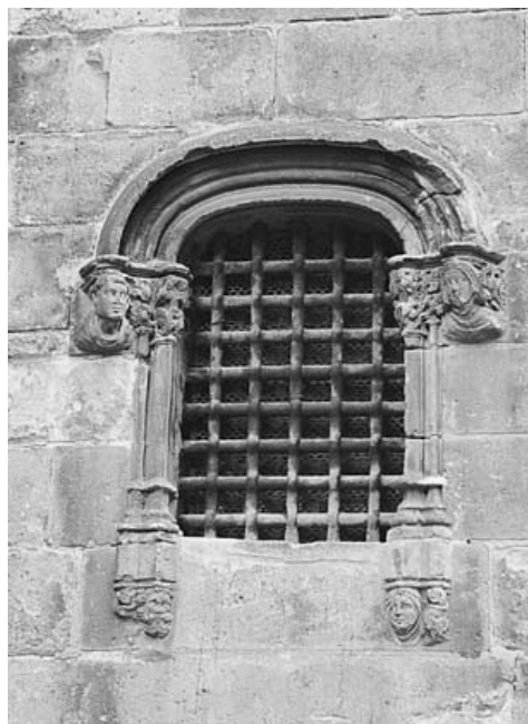
Catedral de Barcelona. Finestra del mur exterior de la sagristia

truït durant el segle XIV era de dimensions reduïdes, la qual cosa obligà a fer-ne dues ampliacions successives, una durant els primers anys del segle XV i, l'altra, a l'inici del següent. Les dues ampliacions donen al carrer de la Pietat i enllacen amb les capelles radials de la capçalera. L'any 1408 s'iniciaren les obres del primer cos afegit, anomenat també Tresoreria, com ens ho confirmen algunes anotacions fetes als llibres de l'Obra i de l'Administració de la sagristia. En aquest espai, utilitzat anteriorment com a fossar ("fossars qui eren la on feren los fonaments de la casa nova que afigen a la sagristia"), 87 s'hi prepararen els fonaments durant els darrers mesos de 1408, i dintre de l'any 1409 ja es construïa la volta. 88