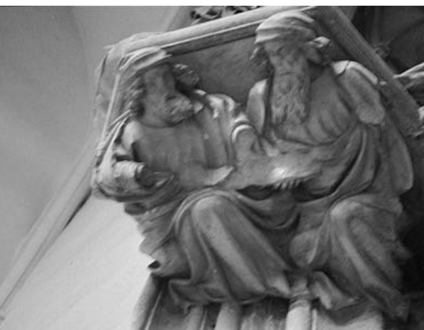
Cartoixa de Champmol (Dijon). Porta de l'església. Detall de la mènsula sota sant Joan Baptista