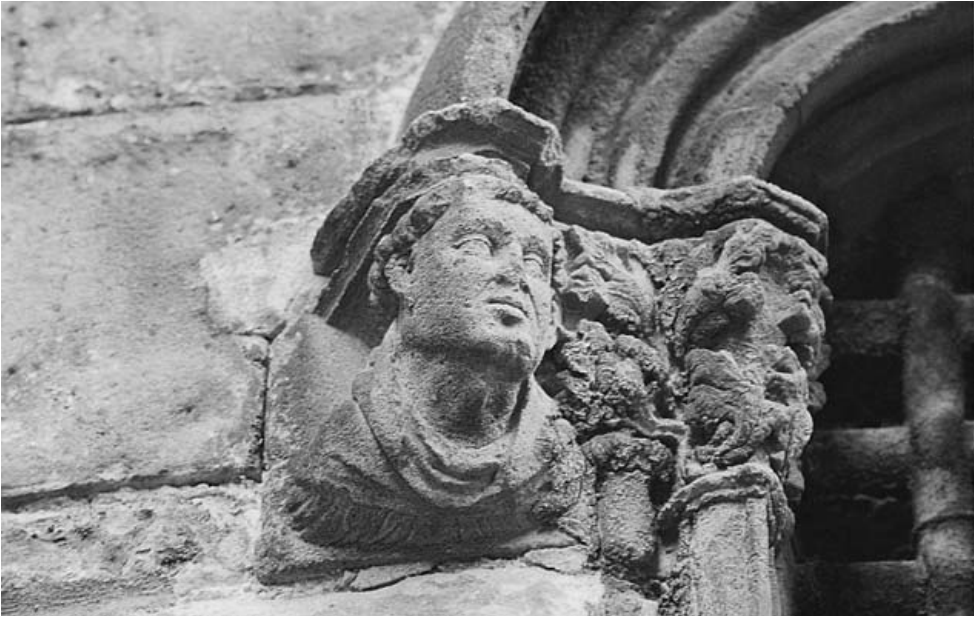
Catedral de Barcelona. Finestra del mur exterior de la sagristia. Detall

També aleshores o poc després es devia treballar en la decoració escultòrica de les seves dues finestres, una de les quals comunica a l'exterior amb el carrer de la Pietat, mentre que l'altra ha quedat a l'interior després de la tercera ampliació de la sagristia, feta al començament del segle XVI. La seva configuració és exactament la mateixa: arc carpanell molt rebaixat que recolza damunt d'a-curadíssimes mènsules en forma de caps humans. A la base dels muntants d'aquestes finestres llueixen altres caps, treballats en baix relleu i també d'una gran qualitat d'execució. El seu estil s'adiu del tot amb la manera de fer del gòtic internacional i, en aquest sentit, connecta molt de prop amb l'obra del cadirat del cor de la catedral. La seva realització no pot anar més enllà de l'any 1409 o de 1410, però ens en falten les proves documentals i, per això mateix, no podem saber qui en fou l'autor. Pere Sanglada ja era mort per aquestes dates 89 i, per tant, hi ha la possibilitat que aquest treball decoratiu fos a càrrec de Francesc Marata, que d'aquesta manera s'hauria reincorporat a l'obra de la seu.