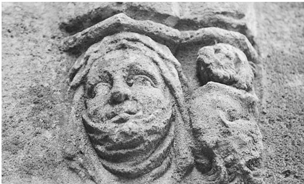
Catedral de Barcelona. Finestra del mur exterior de la sacristia. Detall