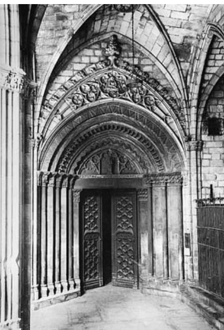
Catedral de Barcelona. Claustre. Porta romànica