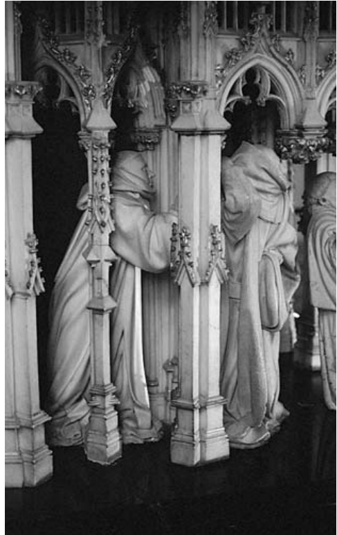
Sepulcre de Felip l'Atreuit (Museu de Belles Arts, Dijon). Detall