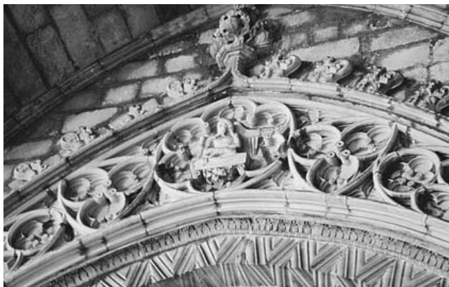
Catedral de Barcelona. Claustre. Porta romànica. Detall

Marata era un bon especialista en aquest tipus de treballs perquè, simultàniament a la seva intervenció en el projecte de la façana de la catedral, degué col·laborar en la integració de l'anomenada porta romànica dins de la nova construcció gòtica. Ara sembla força clar que la coneguda com a porta romànica, una obra datada com a màxim del 1300, estigué sempre en el mateix lloc de comunicació amb el claustre i que cal considerar-la una de les darreres realitzacions de l'anterior catedral, que quedaria integrada en el nou conjunt sense patir cap desplaçament significatiu. 71 Però el que sí que es degué produir fou el seu acoblament a la nova estructura mural, i això implicà algun canvi i algun afegit. Unes anotacions un pèl misterioses, aparegudes en el llibre de l'Obra i que corresponen a l'agost l'any 1402, poden fer-ne referència. 72 S'hi parla de " capsar pedra per fer lo portal de la claustra ", de " l'aparellament del portal de la claustra " i " d'adobar lo dit portal de la claustra ". Per aquelles dates i tenint en compte l'estat de les obres de la seu, la porta del claustre seria un dels accessos principals a la catedral, com també ho era la porta de Sant Iu al cantó oposat del creuer. La superfície mural que hi ha entre les arquivoltes d'aquesta porta i l'arrencada del tram de volta claustral corresponent es guarneix amb un sobrearc ogival amb treball de traceria cega i guardapols floronat. També s'hi incorporen alguns ele-