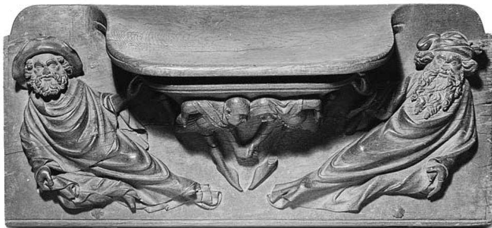
Catedral de Barcelona. Misericòrdia del cor, ara al MNAC