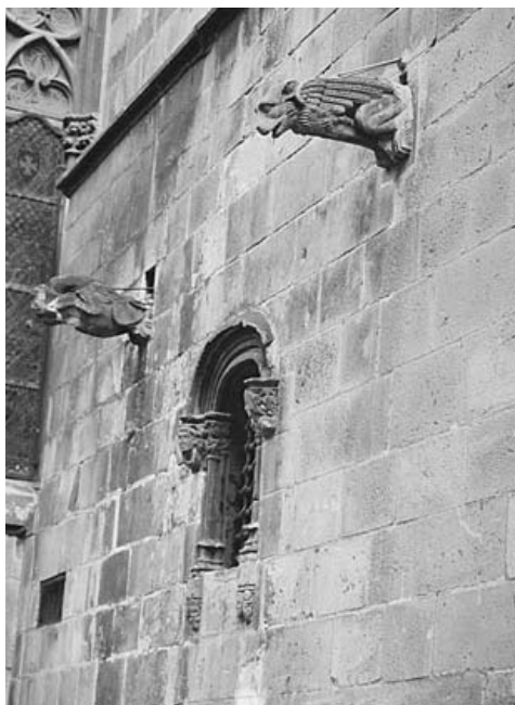
Catedral de Barcelona. Mur exterior corresponent a la primera ampliació de la sagristia

La documentació relativa a la construcció de la seu de Barcelona no es conserva completa; ens en manca el llibre corresponent al bienni 1410-1411, que per ventura ens hauria aportat informació interessant sobre algunes obres, com és el cas dels complements decoratius de l'ampliació de la sagristia. Aquest espai cons-