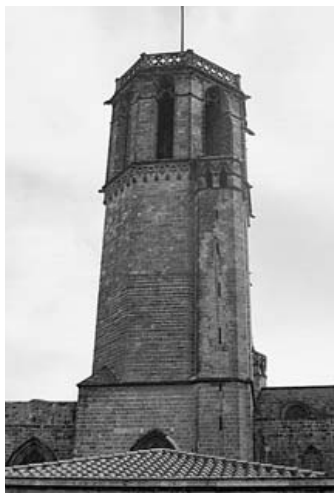
Catedral de Barcelona. Claustre. Ala del carrer del Bisbe.