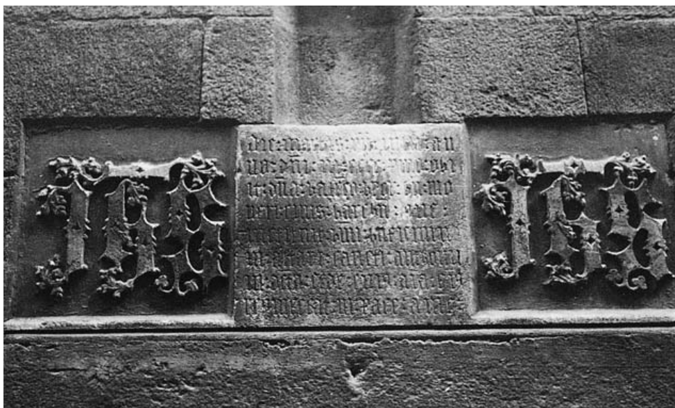
Catedral de Barcelona. Landa sepulcral de Dona Valensa encastada en el mur exterior de la sacristia