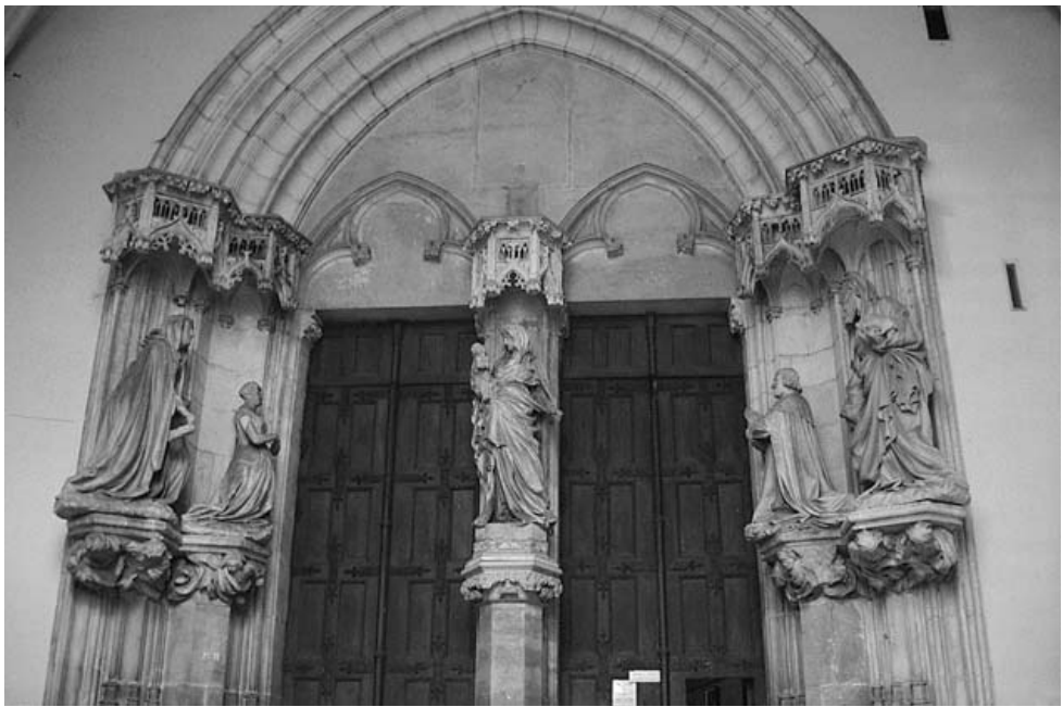
Cartoixa de Champmol (Dijon). Porta de l'església

El dia 2 d'agost de 1383 es posà la primera pedra de l'església de la cartoixa, destinada a panteó familiar, i el 24 de maig de 1387 ja es consagrava sota l'advocació de la Santíssima Trinitat. Però les obres de decoració, tant de l'interior com de l'exterior, tot just s'havien iniciat aleshores i a la mort de Jean de Marville, l'any 1389, encara hi mancava la major part del complement d'escultura. 35 Marville hauria projectat inicialment una porta d'ingrés amb tres estàtues, el duc Felip i la seva muller Margarida als brancals, i la Verge amb el Nen al trencallum, seguint de prop la solució donada uns anys abans a la porta de l'església dels Celestins de París (c. 1370). 36 Però quan va morir només estava acabada la part corresponent al marc arquitectònic i algun element decoratiu com el tabernacle o dosser del trencallum que, més endavant, durant el mestratge de Claus Sluter, també fou substituït. 37