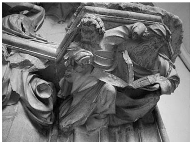
Cartoixa de Champmol (Dijon). Porta de l'església. Detall de la mènsula sota santa Caterina

mateixes estàtues del duc i de la duquessa, probablement iniciades per Jean de Marville i acabades per Sluter, es col·locaren d'una manera provisional i foren reemplaçats després de la visita del rei per uns de nous. 42