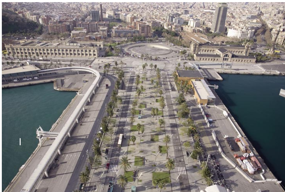
El Moll de Barcelona des de la torre de Jaume I.

El passeig, que integra un aparcament subterrani, té la funció de connectar el gran edifici i la ciutat, d'una banda, i, de l'altra, facilitar l'accés als molls i als vaixells. Una nova plataforma, amb la mateixa amplada que la formada entre les dues terminals anteriors, 75 m, i una longitud de 400 m, relaciona els nous edificis amb la ciutat, i supera suaument la diferència de nivell de 1,50 m entre la base d'accés del World Trade Center i la ciutat. Un passeig central de vianants, de 40 m d'amplada, queda emmarcat per dues calçades per a vehicles que condueixen cap a l'edifici i cap a les rampes d'accés a l'aparcament. Aquestes rampes es troben situades en dues voreres laterals de 10 m d'amplada, que limiten amb les zones de tràfic portuari i contenen a més les escales d'accés a l'aparcament.