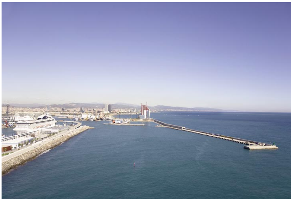
La Nova Bocana del port de Barcelona.

Aquests espais públics són: la prolongació del Passeig Marítim (4a fase) per davant de l'Hotel Vela; la creació del passeig tangent al Passeig Marítim que condueix a l'accés principal de l'hotel i cap els espais públics situats al sud; la prolongació del passeig de Joan de Borbó i del viari cap a tot aquest nou àmbit, on es crea una gran rotonda allargada formada per tres petites rotondes; un espai acompanyat per àmplies voreres-passejos; la gran plaça a la cota 5-6,60 d'accés a l'hotel, que és la gran plaça central de tot l'àmbit de Nova Bocana, on s'han integrat els accessos a l'aparcament subterrani i els accessos vehiculars a l'hotel, per potenciar al màxim els espais de vianants d'accés a l'hotel i d'accés a la plaça mirador situada al sud de hotel a la cota 11; disseny d'accés per a vianants mitjançant rampa adaptada i escalinata; integració de materials i mobiliari amb el Passeig Marítim (3a fase) i amb el passeig de Joan de Borbó.