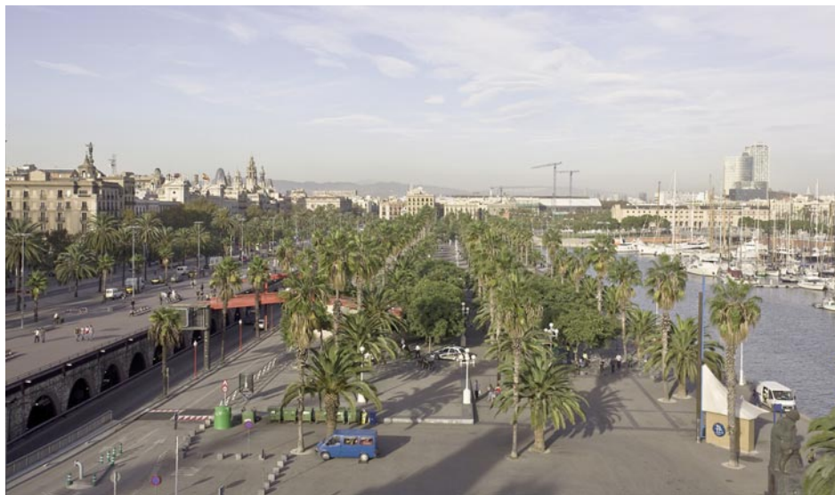
Perspectiva general del Moll de la Fusta després de la reforma de 2004.

Aquestes disfuncions van portar, l'any 2004, a redacció d'un projecte de remodelació, que, entre d'altres, no va poder afrontar dos problemes: 1) La segregació dels carrils de bus al centre de la calçada, substituint el passeig central de principis del segle xx, és una excepció als carrils de bus a la resta de la ciutat, i genera uns espais de vianants infrautilitzats i segregats dels passeigs laterals; si aquests espais s'haguessin integrat als laterals, els dos passeigs serien 6 m més amples. I 2) La Ronda Litoral en sentit nord, descoberta, genera unes contaminacions visual, ambiental i acústica que són incompatibles amb els usos de passeig i de moll urbà; podem pensar que quan es va redactar el projecte inicial no hi havia una imatge clara del que acabaria essent la Ronda Litoral, que s'hagués pogut cobrir en els dos sentits.