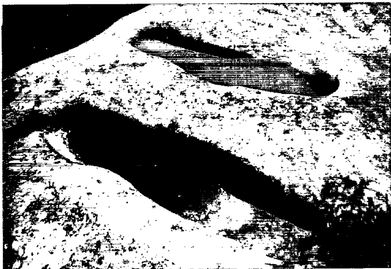
Figura 3 Les sepultures dels Bassis.