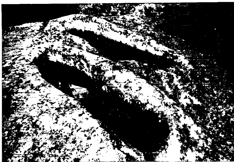
Figura 4 Les sepultures b i a de Pla-ses-lloses.