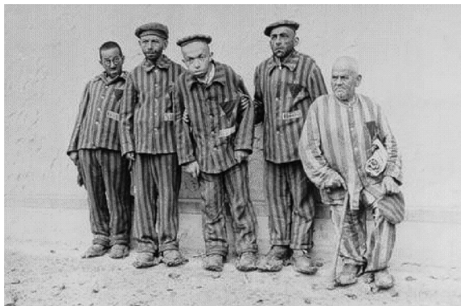
Prisioneros con discapacidad en el campo de concentración de Auschwitz-Birkenau.

permanencia de la reflexión en torno al cuerpo es para Bataille un tema fundamental no únicamente reflexionado, sino vivido desde su infancia. Cuando nació, su padre se había quedado ciego a causa de la sífilis y su infancia estuvo marcada por la ceguera y la posterior parálisis del padre enfermo. El rechazo de la imagen del padre hará que el joven Bataille articule una investigación obsesiva sobre la pureza que necesariamente pasa por escapar del «cuerpo impuro» y enfermo del padre.