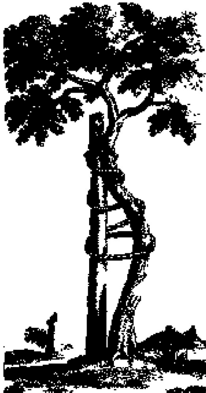
Símbolo de la ortopedia. N. Andry, Orthopédie , 1749.

Pero los cuerpos y las identidades mantienen una relación alterada, tráfuga o anómala. Lo mismo sucede con las construcciones que hacemos con los cuerpos de determinados sujetos. De situaciones exclusivamente intelectualizadas pasamos a situaciones hipercorporalizadas. Aquellos sujetos excluidos son más cuerpo que mente. No se trata de cuerpos embellecidos y esbeltos, sino más bien de lo contrario, de cuerpos envejecidos y en cierta medida grotescos. Nos encontramos con cuerpos con VIH, cuerpos envejecidos, cuerpos maltratados, cuerpos violentados y abusados, cuerpos degenerados, cuerpos paralizados, cuerpos narcotizados, cuerpos mestizos, cuerpos al límite de la frontera, cuerpos monstruosos y cuerpos, en definitiva, que pululan a la deriva de las sombras de la ciudad. Demasiado a menudo convertimos la presencia del otro en aquello que aparentemente es: su cuerpo. Nos olvidamos precisamente de su dimensión más amplia: la persona con su globalidad y su sentido total.