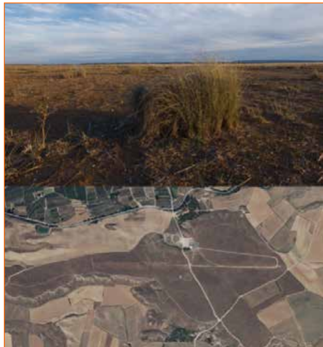
Figura 2. Imagen actual del aeródromo (2023) y las pistas del espacio natural de la Timoneda de Alfés con plantas herbáceas esteparias de secano como el tomillo y el esparto

y atender a las interacciones para buscar soluciones que permitan una relación entre especies más satisfactoria, que es una de las premisas principales del proyecto positivo.