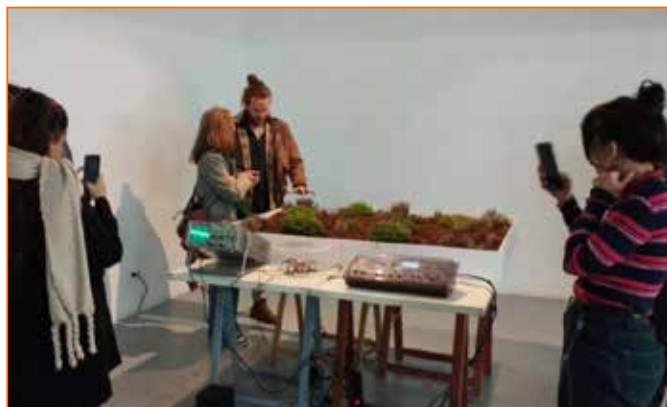
Figura 4. Thymus Vulgaris (2024) en In-Sonora Madrid. Visitantes interactúan con las plantas para transformar el paisaje sonoro de la sala de exposiciones

Observar los cambios producidos por la interacción de las personas sobre las plantas permitió documentar los registros visuales de las notas MIDI con un ordenador y el software Ableton Live 11. La pieza contaba también con un sistema de iluminación LED de crecimiento que estaba operativo durante las horas de luz solar y el personal de sala regaba la pieza habitualmente para favorecer su crecimiento.