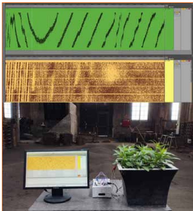
Figura 6. Registros MIDI de más de larga duración sobre dos especies de plantas diferentes. Con fondo verde aparecen los datos del brote de patata y sobre fondo naranja los de flor de pascua durante su exhibición en el festival de arte contemporáneo Embarrat 2023, en el Museo Trepapat de Tàrraga

muchas plantas diferentes de una misma especie, aparecen estructuras visuales similares. En cambio, si comparamos las partituras entre especies diferentes de plantas como una flor de pascua y el brote de una patata (sin que exista interacción humana), podemos observar las notables diferencias visuales que se establecen mediante su representación (figura 6). Hacer visibles estos datos en forma de partituras durante la exposición de un proyecto sobre una pantalla o mediante su impresión en tiempo real puede ser una forma complementaria de ahondar en la comprensión sobre cómo nos relacionamos con otras especies.