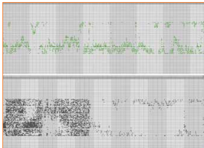
Figura 5. Partituras visuales MIDI de dos días diferentes en el Centro de arte La Panera durante 2023. La imagen superior sin interacción y la inferior con interacción de escolares Fuente: imagen del autor. https://www.lapanera.cat/es/programacion/exposiciones/imaginariis-multiespecies-terres-de-lleida?set_language=es

Durante los tres meses de exposición del proyecto Thymus Vulgaris en el centro de arte La Panera se realizaron diferentes mediciones en forma de partituras visuales con las que evaluar, tanto de forma visual como acústica, la interacción generada entre visitantes y plantas. La figura 5 muestra dos partituras visuales y, en ambas, se hace visible de fondo la misma estructura en forma de dientes de sierra con las notas musicales MIDI. Durante algunos días de la exposición, se ubicó una pantalla en la que los espectadores podían visualizar estos datos en tiempo real.