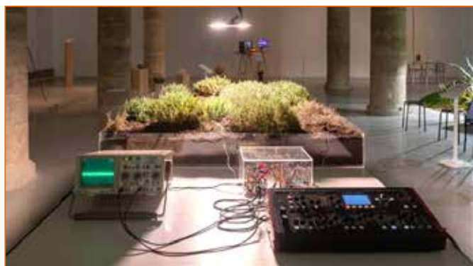
Figura 1. Thymus Vulgaris (2023). Instalación sonora interactiva en la exposición Imaginarios Multiespecies #tierras de Lleida , en el centro de arte La Panera

La obra ahonda en un conflicto medioambiental de carácter político que afectó a la Timoneda de Alfés en Lleida, desde finales de los años setenta del siglo XX, hasta 2014. «La complejidad sobre el trabajo en proyectos que exploran las realidades ecosistémicas, pone de manifiesto los límites epistemológicos de la visión de la ciencia basada en la especialización del saber» (Alonso, Lega y Sgaramella 2022, 511), y cuando se trabaja con estas realidades complejas se requiere de procesos interdisciplinarios como la hibridación entre arte, ciencia y tecnología, para una comprensión más amplia que abarque múltiples áreas del conocimiento. El arte, por lo tanto, se torna una buena herramienta que permite trabajar con un enfoque más integrador estas disciplinas para resolver desafíos ecosistémicos.