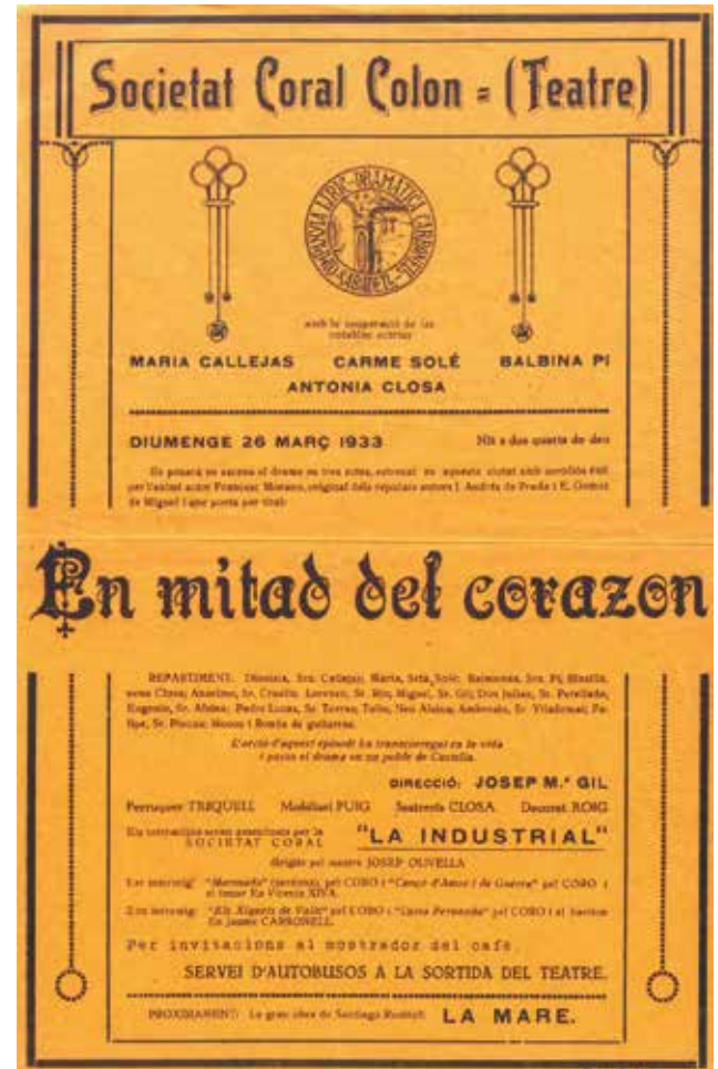
Figura 4. Programa del teatre Societat Coral Colón amb la representació teatral on Balbina Pi figura com actriu, 26 de març de 1933.

tat el 7 de maig de 1921, el titulà “Feminismo. Contestando una pregunta”.