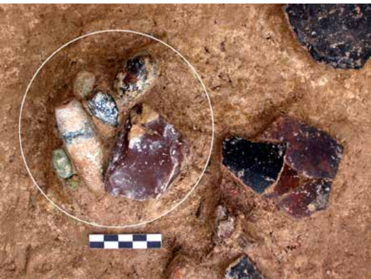
Figura 3. Vista del sepulcre E246 amb un individu femení amb el seu aixovar funerari. Disposa d'un collaret de denes de cal·laïta col·locat al coll i un braçalet al canell del braç dret, just a tocar d'un vas de ceràmica de boca rectangular. S'observa un dipòsit votiu a la zona de la capçalera, per damunt del cap de l'individu, format per un collaret de 9 denes de cal·laïta, una d'elles de grans dimensions, i un nucli de sílex.