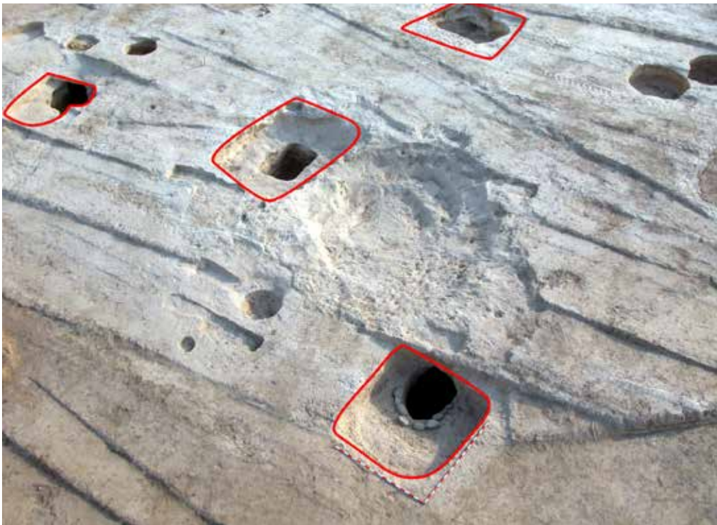
Figura 1. Vistes generals de la necròpolis neolítica de Can Gambús, amb indicació d'alguns dels sepulcres monumentals.