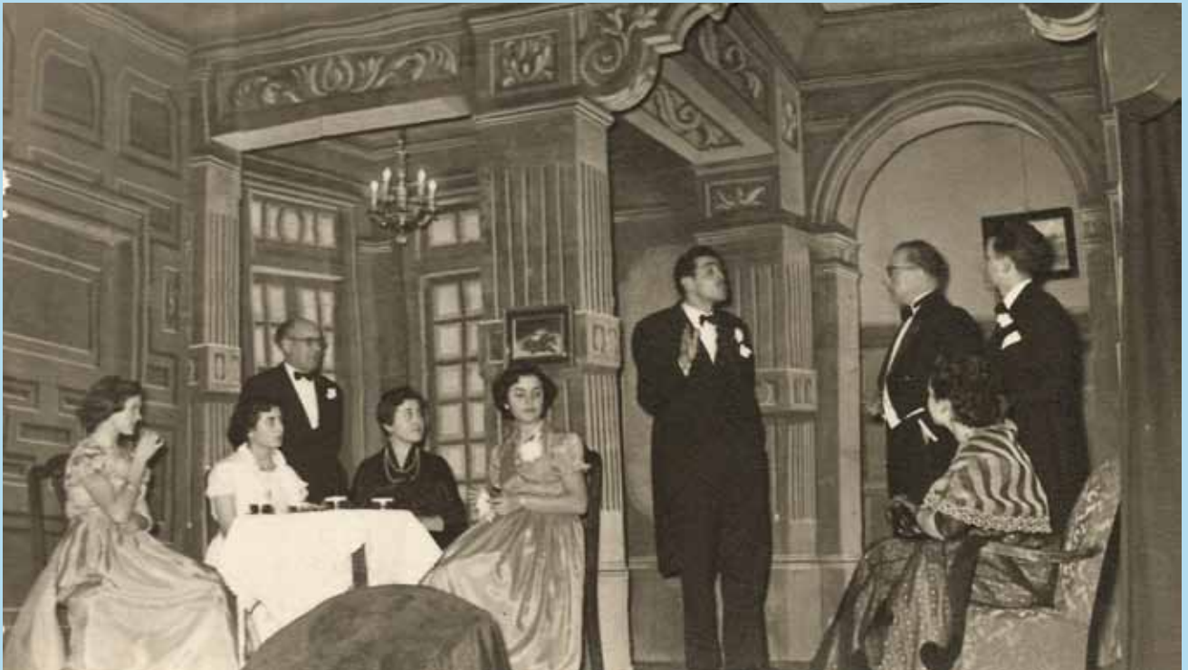
Fotografia 9. Representació de l'obra Miss Thery l'abril de 1955, a càrrec del Centre Parroquial Sant Vicenç, en el nou teatre al carrer de Llevant.