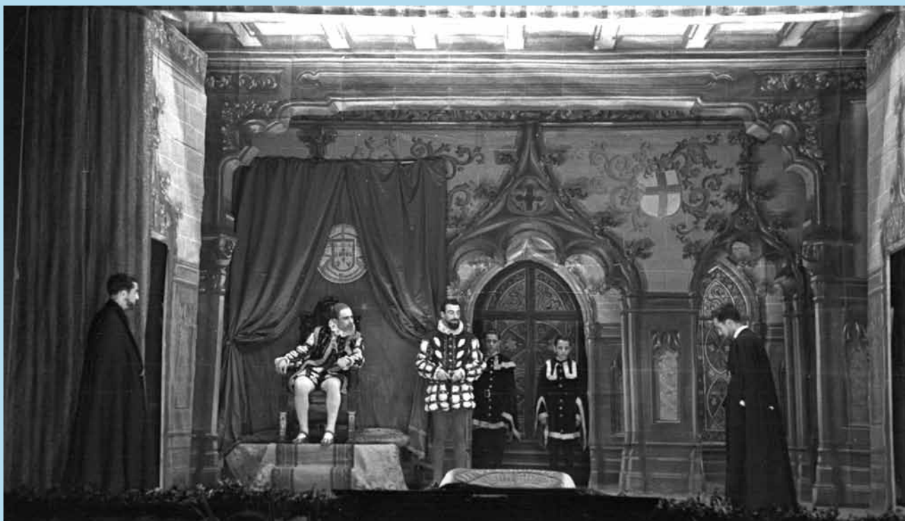
Fotografia 5. Representació de La Ventafocs, el 5 de febrer de 1950, al Teatre Alcázar, a càrrec de la Joventut de la Faràndula. Autor: Joan Balmes i Benedicto (AHS. Fons Joan Balmes. JBBo27422).