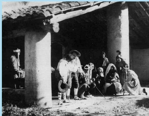
Fotografia 3. Representació d'Els pastorets, a la masia de Can Vilar, a càrrec de la Secció Dramàtica de l'Acadèmia Catòlica de Sabadell. Dècada de 1920. Autor: Francesc Casañas i Riera (AHS. Fons Casañas. FCR01264).