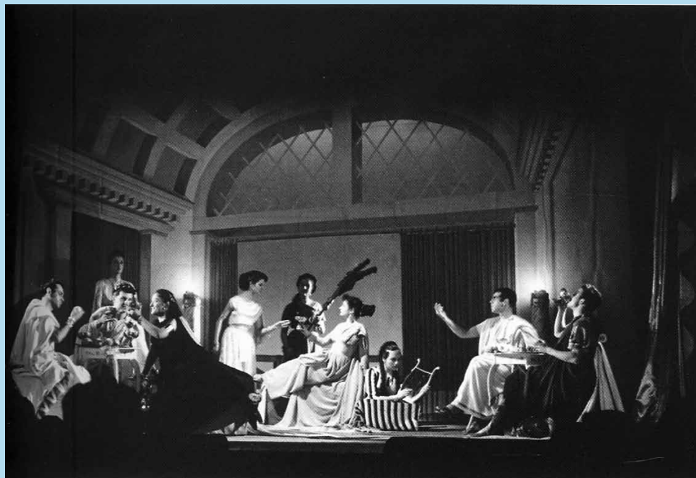
Fotografia 10. Representació de Ponç Pilat, amb escenografia de Rafel Esteve.