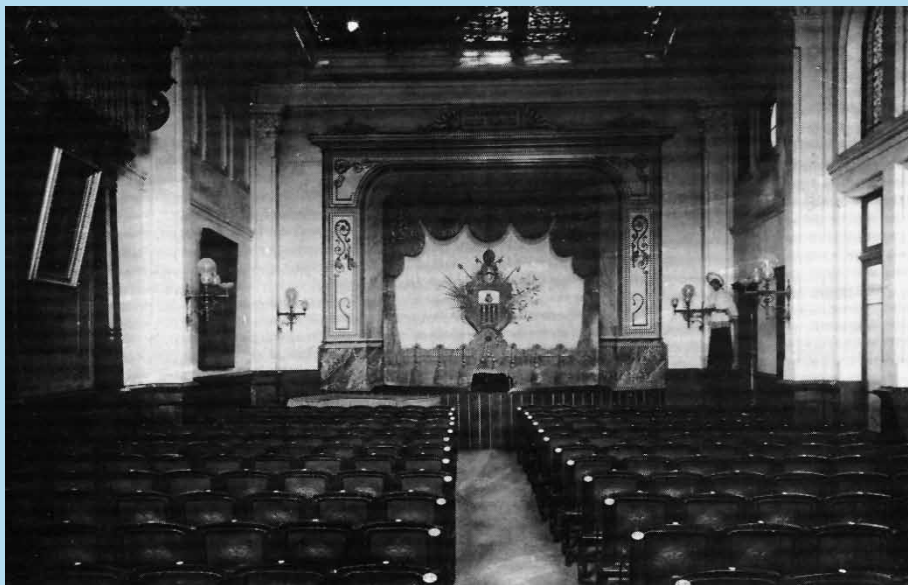
Fotografia 1. Sala de teatre de l'Acadèmia Catòlica. Sabadell, anys 20. Autor: Francesc Casañas Riera (AHS. Fons Casañas. FCRo2854).