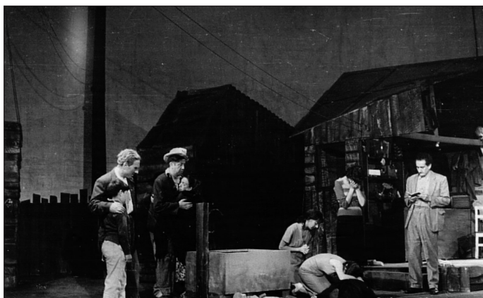
Población Esperanza , de Isidora Aguirre.