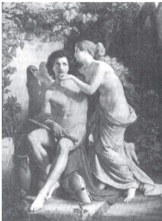
Fig. 5. Eduard Daege, La invenció de la pintura , 1832, Nationalgalerie, Berlín.

s'aparten de la llum. Aquesta ombra és l' ombra inherent 27 . D'altra banda, és evident que el sector G rep més llum que el sector del cap entre E i B, on l'angle d'irradiació respecte a la superfície és més obert. Aquest tipus d'ombra, que ho és només en un sentit parcial, i es veu sempre com una gradació d'enfosquiment, és l' ombreig 28 . Evidentment, des del punt de vista de la definició anterior de la ciència moderna, possiblement aquestes distincions no siguin decisives, però el ben cert és que, des del punt de vista de la descripció de com l'ombra és percebuda, són capitals. Observem tots els matisos de la descripció fenomenològica de l'ombra prenent com a model el quadre d'Eduard Daege, La invenció de la pintura 29 .