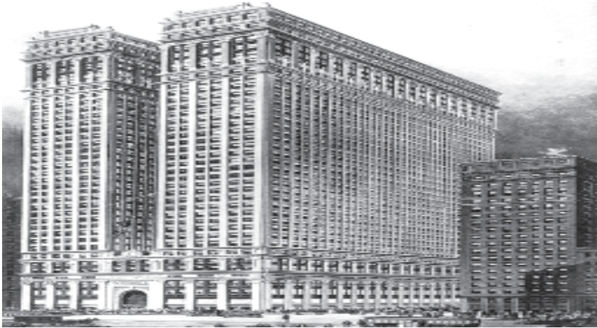
Fig. 2. Equitable Building , de l'arquitecte Ernest R. Graham

Mitjançant la conseqüència aporètica del trencaclosques de l'ombra, podem ara argumentar per no haver de pagar impostos. Imaginem una caseta sota el sol. Al costat d'ella es construeixen dos gratacels, el petit i el gran. Com determinar, basant-se en el trencaclosques de l'ombra, quins dels dos gratacels ha de pagar la compensació a la caseta? El gratacel gran no pot projectar ombra sobre la caseta, perquè aquesta no pot passar a través del petit. Però el gratacel petit tampoc pot projectar la seva ombra sobre la caseta, atès que no rep llum. Qui ha de pagar la compensació a l'amo de la caseta? Sense una solució al trencaclosques de l'ombra, els especuladors saben que, per evadir els impostos, tan sols han de construir dos gratacels de distinta grandària alineada, en comptes de dos en llocs separats.