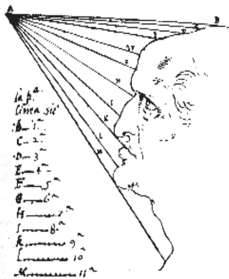
Fig. 4: Rostre il·luminat, de Leonardo

Què és l'ombra? És l'ombra pròpiament una cosa, o un objecte, o és tan sols l'absència o insuficiència d'un altre ens? Aquestes preguntes ens situen en l'òrbita de problemes de l' ontologia de l'ombra. Les preguntes que suscita l'ontologia de l'ombra no són, malgrat les seves aparenances, gens fàcils de tractar, i menys encara de respondre. Des del punt de vista de la ciència moderna, la definició d'ombra presenta dues vessants, que