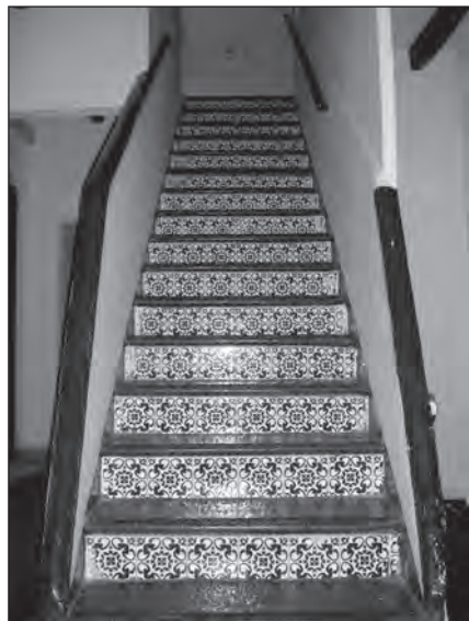
Escala d'accés a la planta segona.

Primera planta. La primera planta disposa d'un total d'onze estances, entre elles les que ocupava el propietari. Aquestes últimes se situaven a llevant i tenen una petita terrassa i una escala que comunicava directament amb l'exterior. Pel que fa a la sala, les dimensions actuals són molt reduïdes, i la meitat del que antigament va poder ser la seva dimensió està avui ocupada per una dependència que fa les funcions d'oficines del negoci d'hostaleria.