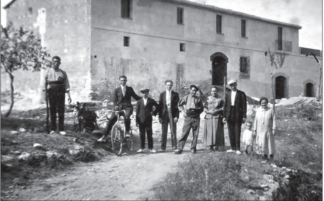
El Mas Trader als anys trenta. Hi destaca que encara no s'havia construït el segon pis ni la porta del celler.

Pedro i del Mas Xinxola. El Mas Trader i el Mas Xinxola provenien de la branca dels Papiol, mentre que el Mas d'en Pedro era dels Torrents.