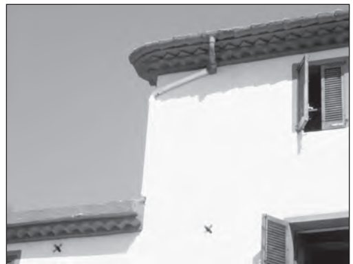
Detall dels ràfecs (primera i segona planta).

Un fet destacat són els careners del Mas Trader, paral·lels a la façana principal. Aquest fet, present tan sols en les masies del tipus I, implicava la construcció de canalitzacions que, alhora que servien per a l'emmagatzematge d'aigua de pluja, evitaven que aquesta caigués sobre les portes i finestres principals del mas. Avui en dia, amb l'aigua corrent, les canalitzacions de les teulades desguassen directament a terra, en unes gàrgoles molt senzilles i austeres.