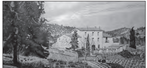
Dibuix del Mas Trader als anys 50.