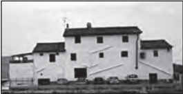
Imatge posterior de la masia del Trader.