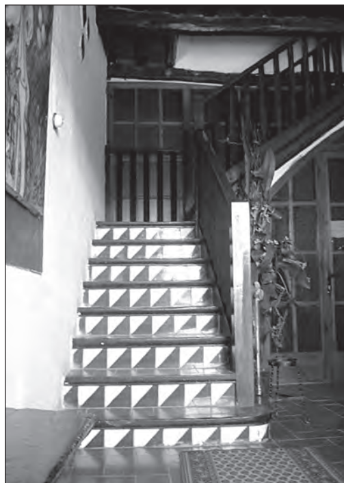
Escala del vestíbul per accedir a la primera planta de la masia.

Pel que fa als solers, el sòl de la masia era fet de rajoles rústegues de terrissa. També en aquest cas, el pas del temps no ens ha deixat mostres rellevants dels solers tradicionals. El motiu és l'elevat desgast dels materials antics per la neteja, el fregament per l'ús o les pàtines que sorgeixen amb la humitat.