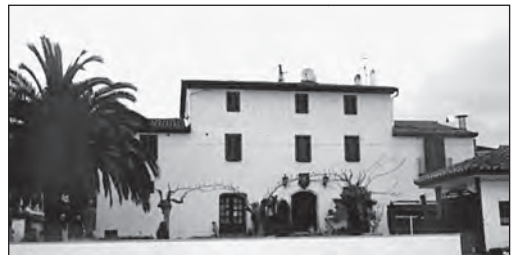
Imatge frontal del Mas Trader en l'actualitat.