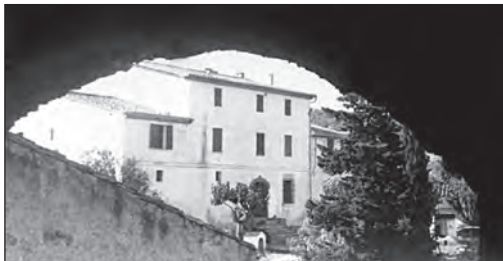
El Mas Trader als anys cinquanta. La façana tenia només una porta.

El gal va presentar el projecte d'urbanització del primer sector, la part sud, el qual s'entrà a l'Ajuntament el mes de maig de 1975, i fou aprovat pel consistori el 10 de desembre. El plec amb les característiques de la promoció urbanística incloïa els