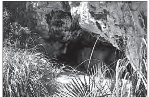
La cova del Trader, situada a prop del límit amb Castellet.

Una altra de les curiositats del Mas Trader és el seu nom al llarg dels anys. Mossèn Avinyó, a inicis del segle XX, ens en