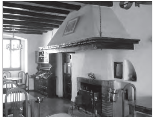
Xemeneia de l'antiga cuina, avui menjador.

Planta baixa. A la planta baixa de la masia s'hi trobaven el distribuïdor o vestíbul, el menjador, la cuina, el celler i la vaqueria, estances típiques de la masia catalana. El vestíbul és una estança habitual en l'estructura clàssica. En el cas del Mas Trader la seva dimensió és reduïda, amb un banc de fusta enquestat a la paret a mà esquerra. No hi ha cap espiell, almenys no se'n conserva cap en l'actualitat. Les escales d'accés a la primera planta són al davant, pujant en forma d'ela cap a la dreta. Sota escala hi ha una porta que du a un passadís posterior que comunica amb