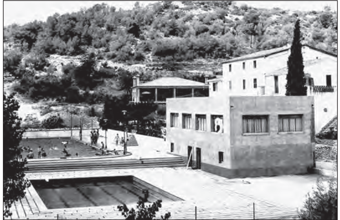
El Mas Trader a finals de la dècada dels 60.

aspectes relacionats amb la xarxa elèctrica, el sanejament, l'asfaltat i l'enllumenat dels carrers. El segon sector, al nord, presentà el seu projecte l'any 1976. Va ser autoritzat per l'Ajuntament l'any 1977.