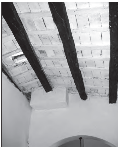
Bigam del sostre a la segona planta.