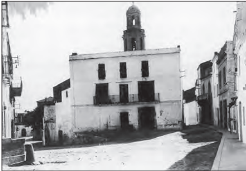
Fleca dels Cibiach, al centre de la imatge de la plaça de la Font.

FLECA CIBIACH. Una de les fleques més emblemàtiques de la nostra vila,