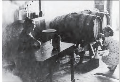
Taverna de Cal Saragossa, actual Restaurant La Font.