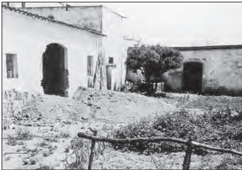
Interior del magatzem i molí de Cal Safons, al costat de la carretera.

Gumà, en la seva Memòria descriptiva del Ferrocarril de Valls a Vilanova , destacà que Cubelles exportava el 87% de la seva collita de raïm, dada que mostra la importància d'aquest conreu per a Cubelles, que durant el segle XIX i XX va ser el principal de la nostra agricultura.