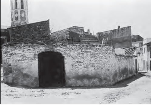
Taller de bótes i magatzem d'olis i vins de Cal Safons, al carrer del Mig número 2.

vins. Els cubellencs de la família Safons que en aquests cinquanta anys van fer bótes foren: