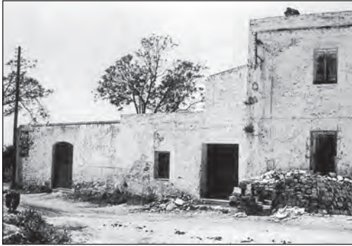
Magatzems i premses d'oli i vins de Cal Safons, al carrer de l'Estació, a tocar de la carretera.