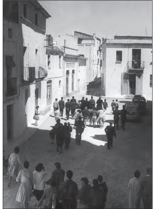
Carrer de Colom, amb Cal Panxo (primera porta per l'esquerra) i la Cooperativa La Salvadora (quarta porta per l'esquerra). La porta de la dreta era una de les entrades del Cafè de Baix.