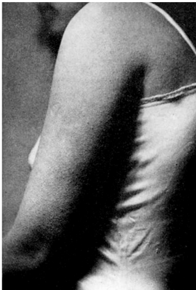
FIGURA 4. Pacient amb frinodèrmia hipotiroïdal. Imatge inclosa a la primera descripció de la síndrome feta per Vilanova i Cañadell 22

El mateix any, Vilanova i Cañadell comunicaven un tercer cas amb característiques similars als dos anteriors 24 . Els tres casos esmentats, més un quart, foren presentats