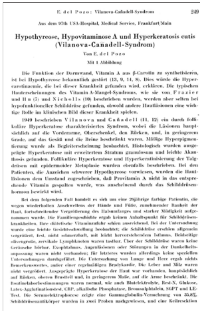
FIGURA 5. Primera pàgina de l'article d'E. Del Pozo, on es parla de la síndrome de Vilanova-Cañadell 2