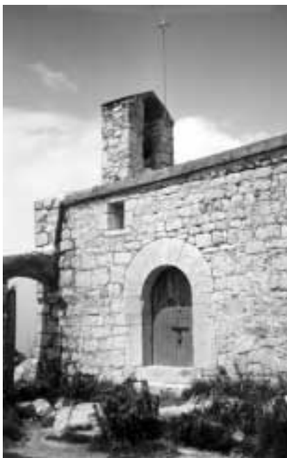
Capella de Santa Magdalena, antiga Santa Maria del Codó, situada en un punt estratègic prop la vila de Terrades.

de ser ambos perceptores del Diezmo del termino y parroquia de Boadella, del termino y parroquia del pueblo de Palau Surroca, y parte del termino de Terrades; protocolizo el mismo expediente uniendolo al efecto original y á continuacion en este mismo protocolo de escritura publica del corriente año”.