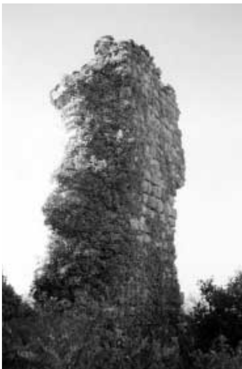
Únic fragment de mur del castell de la Roca, terme de Terrades, que es conserva en peu avui dia.

una reductio del mas Padrosa de Val, de la parròquia de Terrades, ab salvo iure i prestatio de 25 sous quiscun any al benefici de Sancta Magdalena de Codó”.