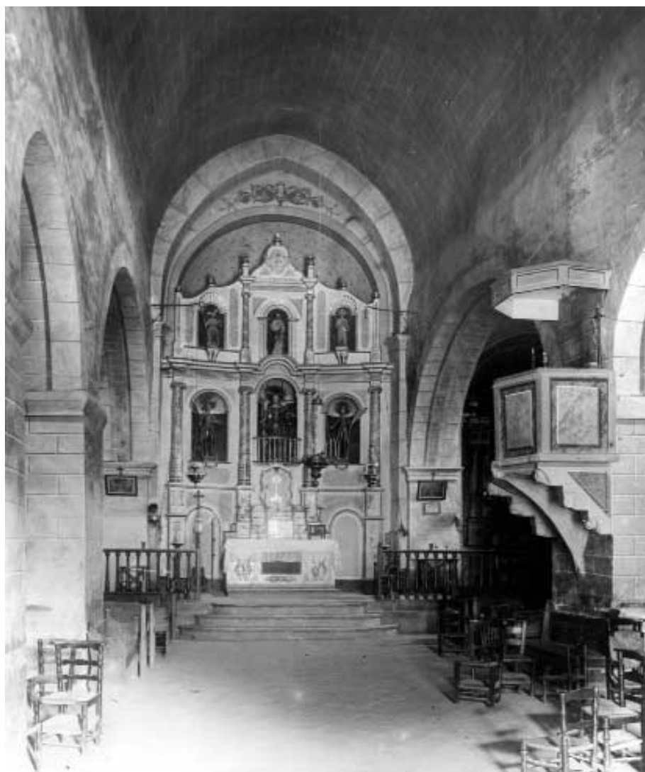
Interior de l'església parroquial de Santa Cecília de Terrades. Fotografia de l'any 1916, abans de la seva destrucció.

conservaven, el sumari de totes les escriptures que tenien o podien tenir alguna relació amb propietats eclesiàstiques. Els volums que confeccionà, un pel segle XIV, un altre pel segle XV, i un tercer pel segle XVI, porten com a títol Escrituras y cosas varias referentes a las parroquias de San Lorenzo de la Muga, Terrades y Boadella . Aquest títol, però, no reflecteix correctament el seu contingut i és clarament posterior a l'escriptura dels inventaris, que no porta cap mena d'introducció ni comentari i, per aquest motiu, hem optat per