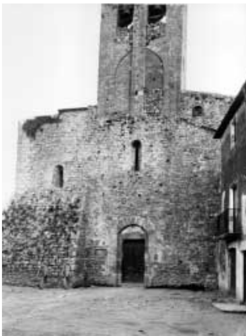
Façana de l'església parroquial de Santa Cecília de Terrades. Fotografia de l'any 1916, abans de la seva destrucció.