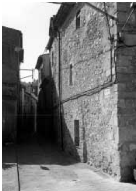
Carrer de la Salvetat, entrada a l'antic recinte de la Salvetat del Sant Sepulcre, vist des del carrer Major de la Vila de Terrades.