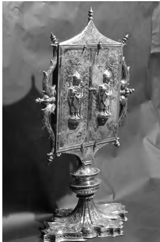
El reliquiari era tret en processó durant la festa del patró Sant Ot.

Una singularitat important de la processó de Sant Ot era la interpretació de cants litúrgics propis del Corpus. El Compendio ja especifica que la processó es fa «cantando los himnos del Augusto Sacramento Pange lingua y Sacris solemnii, tributándole la adoración latría», i ja hem vist com la relació de la visita ad limina de l'any 1821 encara ens refereix com «es canten himnes al Sagrat Cos de Crist». 50 Tot i la importància del culte al Corpus en aquest moment, 51 pensem que el fet que es cantin els himnes del Corpus per la festa de Sant Ot s'ha d'atribuir especialment a la veneració dels Corporals, com a prova material de la transsubstanciació eucarística. En aquest sentit és prou significatiu un repàs als cants litúrgics que figuren al Processoner de l'any 1527 vinculats a la festa de Sant Ot. Si comptabilitzem el total d'himnes, antífones, responsos i altres fórmules que s'interpretaven durant la festa i l'octava de Sant Ot en trobarem un total de setze, nou de les quals s'interpretaven també per la festivitat del Corpus, a més d'altres cants no especificats, també coincidents amb el repertori propi de Corpus («et alia ut in processione Corporis Christi»). 52