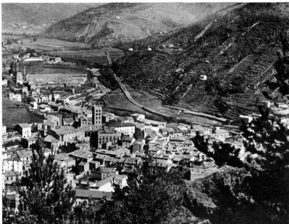
Vista general de Ripoll

En els dies 6, 7 i 8 d'agost varen morir els tres enterramorts. En un sol dia, el 15 d'agost, hi hagueren quinze defuncions. Algunes bones persones abnegades es dedicaren a soterrar els nombrosos difunts; molts ho eren en el mateix lloc de la defunció. Va morir el senyor Abat del Monestir, Francesc de Copons i Vilaplana a Vallfogona; dos monjos, un domer i tres capellans. Degueren produir-se, sens dubte, molts casos fulminants sense poder rebre cap auxili; trobem referències de moltes persones a les quals atrapà la mort a l'hort, al camp o al torrent. Tan sols pels horts, se n'hi registren una vintena: