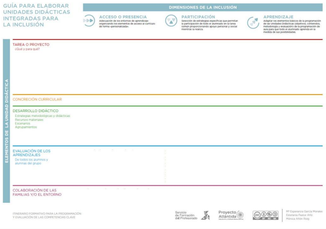
Figura 1. Guía para elaborar unidades didácticas integradas para la inclusión

Para ello utilizamos dos organizadores que son el fundamento de su diseño, los elementos de la Unidad Didáctica Integrada y las dimensiones, previamente definidas en este artículo, de la inclusión educativa.