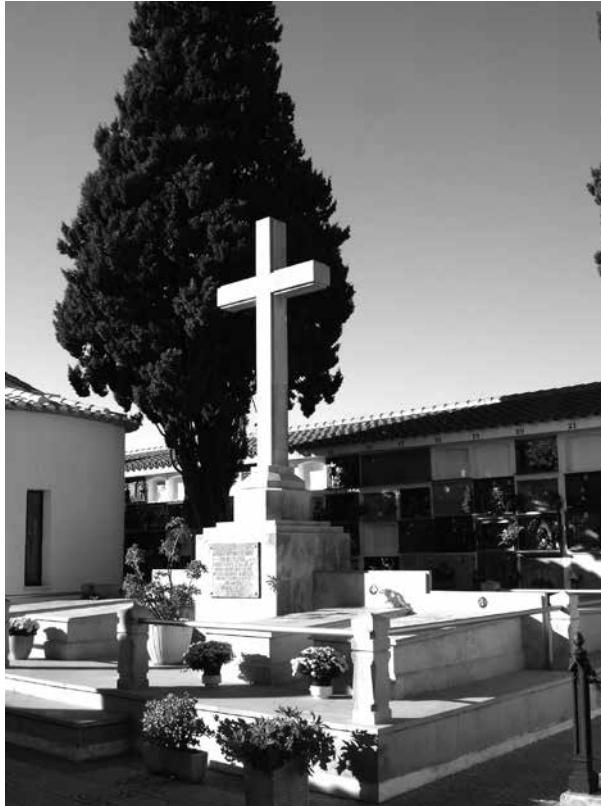
Monument al cementeri d'Ondara amb la dedicatòria: “Mausoleo dedicado a los caidos por Dios y España, por nosotros y nuestra sangre vertida, el espíritu de la raza hispana hablará. Ondara, I-XI-939”.