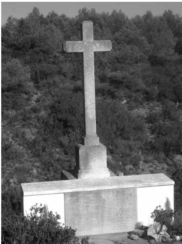
L'any 1941 es realitzà un primer monument sobre l'avenc del cap de Sant Antoni (Montgó). L'any 1991 es reformà aquest monument en record dels deniers assassinats el 2 de novembre de 1936.

Les característiques especials d'aquest assassinat en grup fa pensar que es tracta d'un assassinat planificat, tots ells estaven detinguts al mateix lloc, al depòsit municipal, la presó situada als baixos de l'Ajuntament.