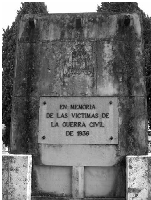
Monòlit del cementiri de Pego dedicat a les víctimes de la guerra civil.