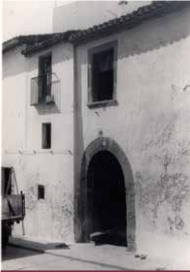
Imatge exterior de la ferreria.