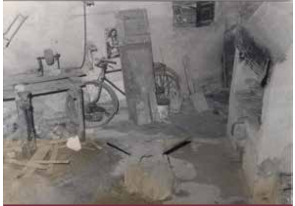
Imatge interior de la ferreria.