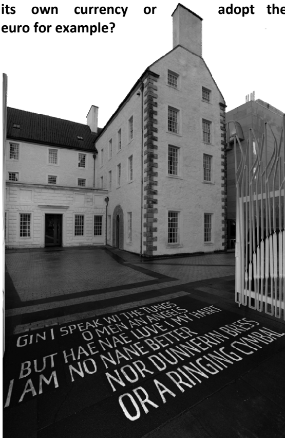
© Scottish Parliamentary Corporate Body – 2012

Scotland certainly could issue its own currency, but the SNP Government would prefer to find a way of maintaining the Bank of England's monetary policy framework to help underpin the Scottish economy. So its policy is that an independent Scotland would use the pound sterling, and would look to a direct relationship with the Bank of England to coordinate Scotland's fiscal policies with the needs of a Rest-UK/Scottish shared currency area. It is not yet clear what kind of relationship the Bank of England would foresee with an independent Scotland. The UK Government does not favour a system of sterling area governance that would give an independent Scotland a role in sterling zone monetary policy. The Euro remains in principle an alternative in the longer term, but given the Eurozone's current problems is unlikely be a real alternative for the foreseeable future.