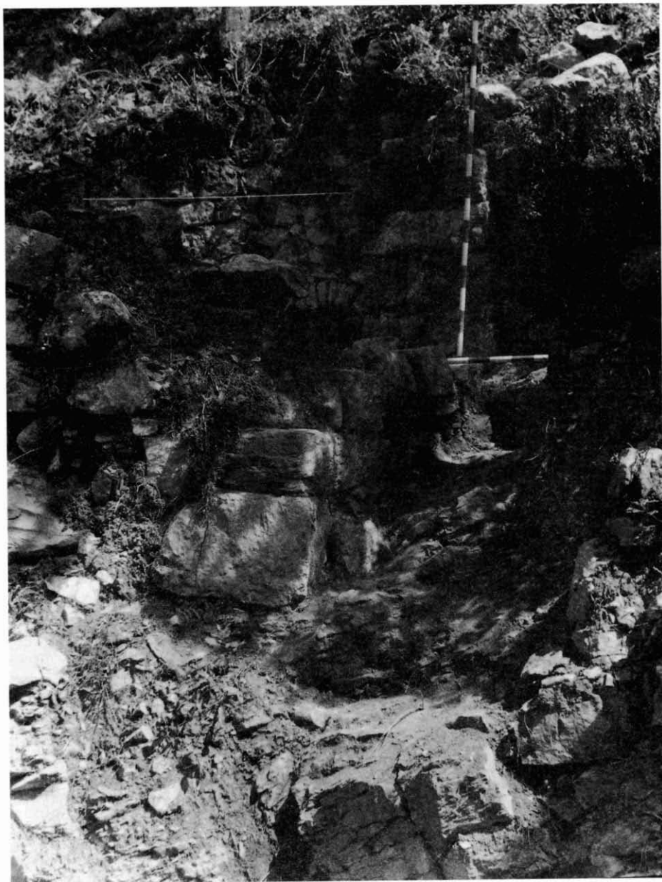
8.- Barri de Mataplana. Escala d'accés a l'Habitació núm. 2.