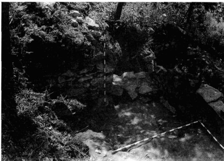
7.- Primeres habitacions del Barri . Porta d'accés a l'Habitació núm. 1.

La nova habitació resta situada a la part alta del vilatge o Barri , a 16,35 m. de profunditat del punt zero, i a la banda meridional del castell i, sens dubte, a un nivell més baix que aquest. De planta trapezoidal, fa 4,90 metres al mur Nord, 6,25 al Sud, 3,30 a l'Est, i 2,70 a l'Oest. De les seves parets, que fan de 65 a 80 centímetres de gruix, en queden sols de set a cinc filades. A la paret Nord, que recolza damunt la roca viva en la seva major part, hom pot veure-hi dos encaixos laterals, destinats a sostenir bigues, o troncs inclinats (de 21 \times 23 \times 12 cms), i un arc de descàrrega, amb sis dovelles, que uneix dos sectors de la penya en la qual hi havia una falla. Damunt d'aquest arc cec, que a la vegada corona un armariet obert al tou del mur, resten en peu encara sis filades de pedra, amb la qual cosa l'alçada màxima conservada d'aques mur és de 2,10 metres, apropant-se a la que deuria tenir inicialment. L'existència dels dos encaixos fets a la roca ens va fer pensar en una possible coberta de lloses a dues vessants, però no en tenim cap més testimoni.