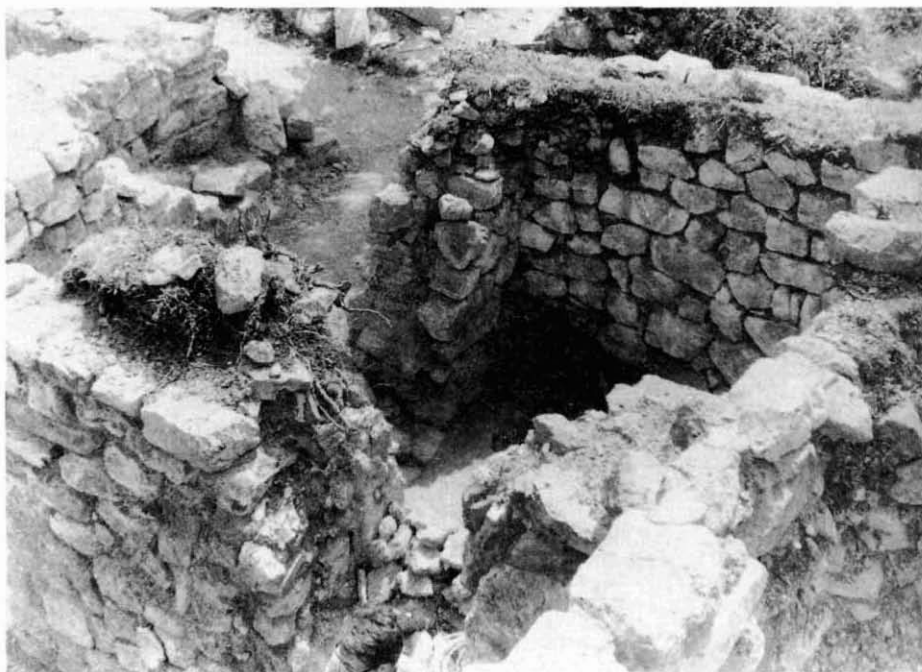
5.- Murs que delimiten el Sector 13, al costat de la porta d'accés al castell.