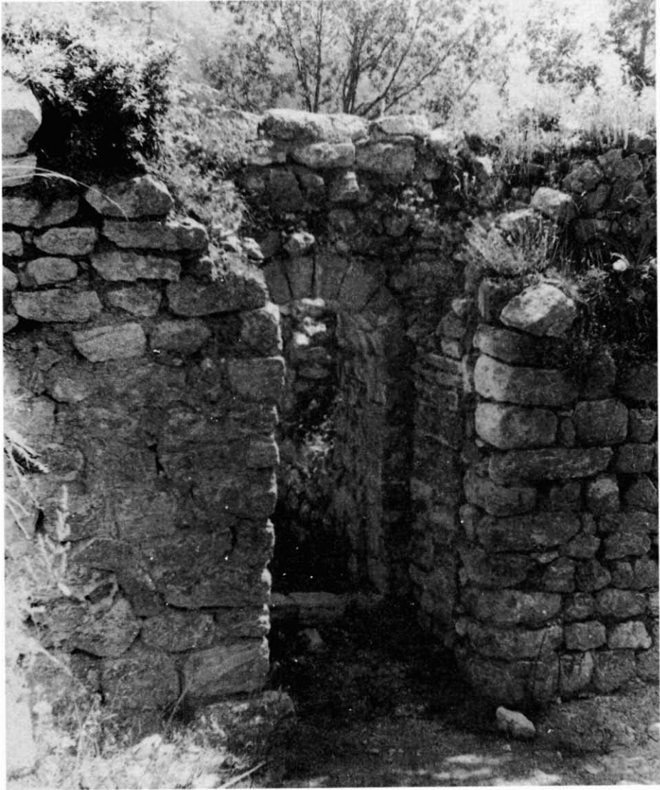
2.- Costat W. de la porta de pas de la primera aula-capella al pati interior (Sectors 5 i 7). Observi's el parament del primer romànic dintre del mur actual.