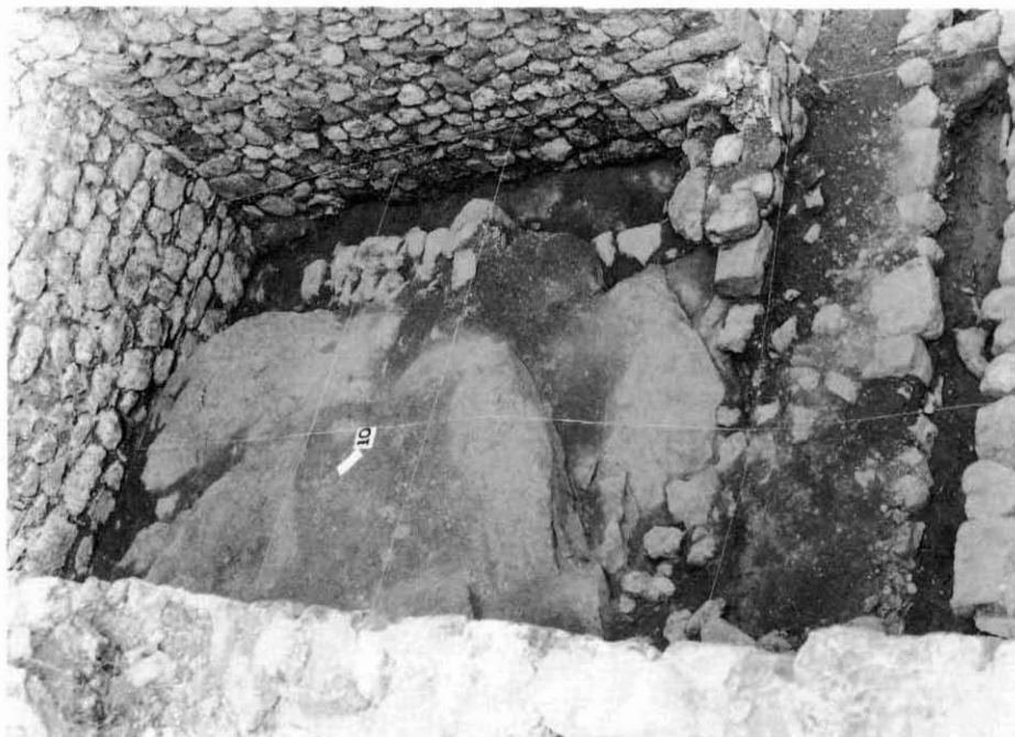
3.- Aspecte de les quadrícules del Sector 10 amb l'encaix fet a la roca per bastir-hi el mur circular de la primitiva torre cilíndrica (segle XI)

correspondre al primer pis del castell i possiblement a la paret de la galeria bastida damunt d'un sostre de guix, les restes del qual han seguit apareixent en les noves quadrícules.