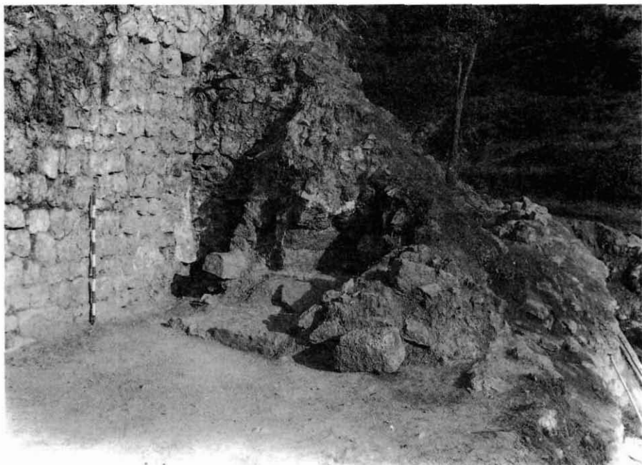
6.- Aspecte del Sector 15, amb el forn del segle XIII i la xemeneia adossada a la cara externa de la muralla Nord.

la profunditat de 17 metres hi havia el paviment de l'Habitació núm. 1. La buidada ha estat molt lenta i pesada per les dificultats que presentava la quantitat de runa acumulada entre els arbres que s'han apoderat de tot el Barri. No fou tasca fàcil la de localitzar els quatre murs d'aquest nou recinte. En la neteja superficial es recuperà tan sols una mandíbula de gos i una esquelleta de coure tardana.