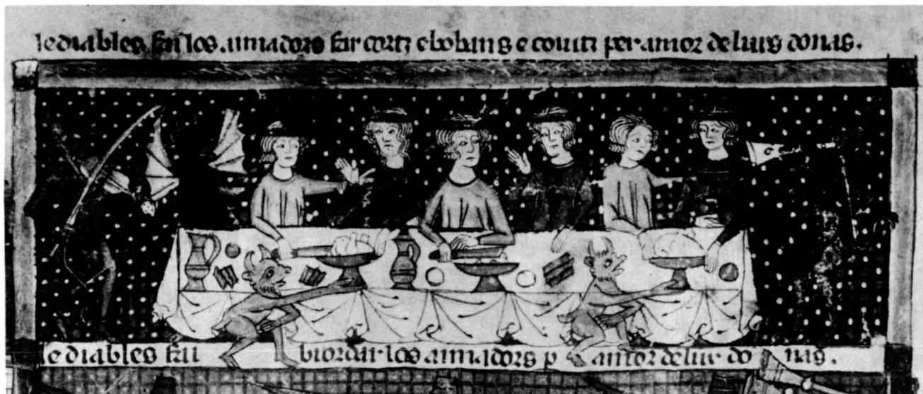
Fig. 2. Miniatura pertanyent al «Breviari de l'Amor» de l'Escorial, obra de Malfré d'Armenjol — segle XIV.