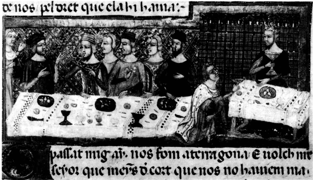
Fig. 1. Jaume I a casa de Pere Martell. Crònica de Jaume I — Biblioteca Universitària, Barcelona.